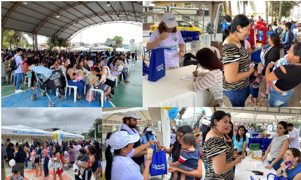
Imagen 104. Entrega de suplementos alimenticios por parte de la Fundación Crezco Nut.