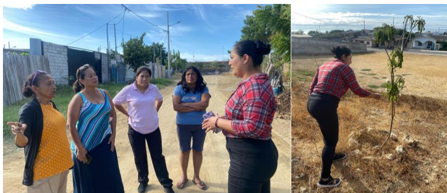
Imagen 43. Inspección INSITU en el Barrio Las Colinas.