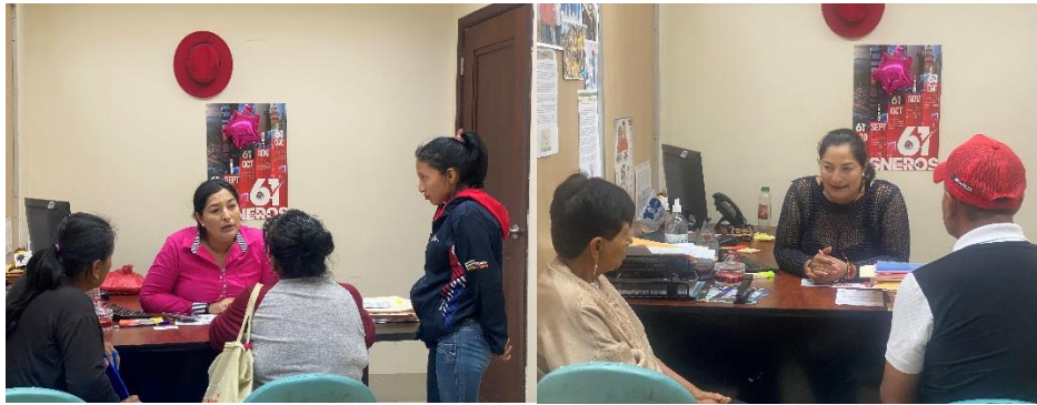
Imagen 83. Atención a usuarios en oficina de la sala de concejales 2 del GADMCLL.