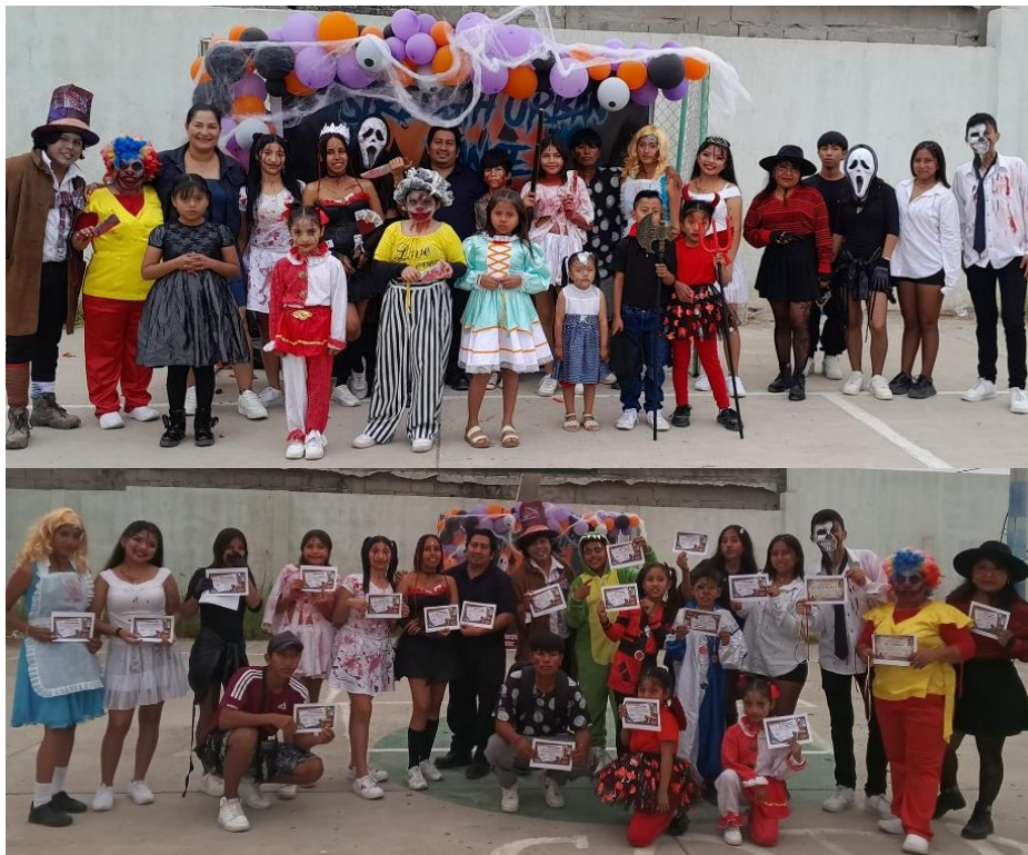
Imagen 147. Evento de danza de la academia de baile "Strength Urban Dance".