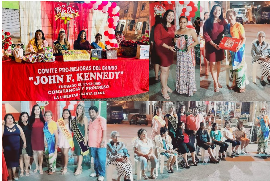
Imagen 39. Día de las madres del Barrio John F. Kennedy.