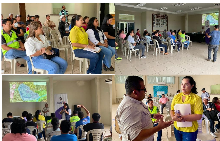
Imagen 82. Reunión informativa del Proyecto "Ampliación del Estudio de Mejoramiento y Rehabilitación de la Laguna de Oxidación de Punta Carnero, Salinas Muey y La Libertad".