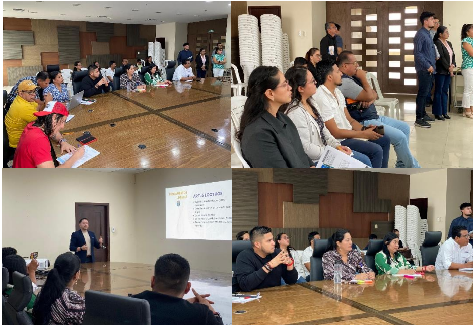
Imagen 156. Mesas de trabajo para revisar y analizar la actualización del PUGS y del PDOT.