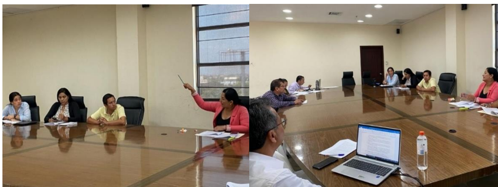
Imagen 1. Mesa de trabajo referente a la Ordenanza de Arbolado Urbano del Cantón La Libertad, en la sala de sesiones del Palacio Municipal.