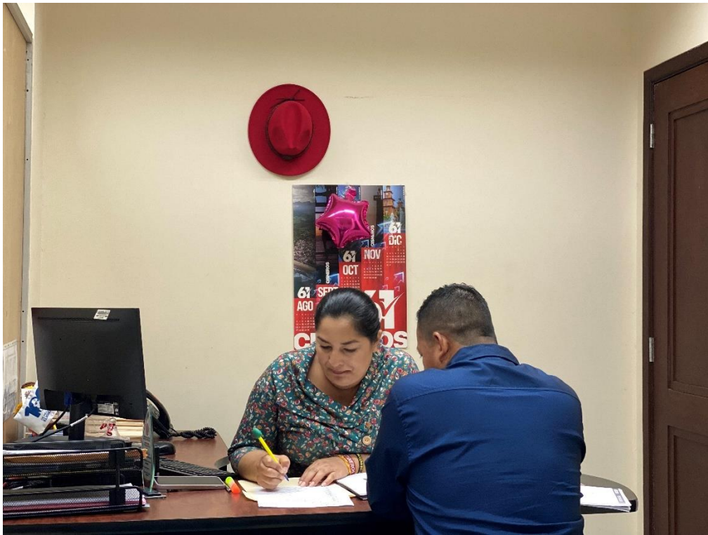
Imagen 120. Atención a usuarios en oficina de la sala de concejales 2 del Gobierno Autónomo Descentralizado Municipal del Cantón La Libertad.