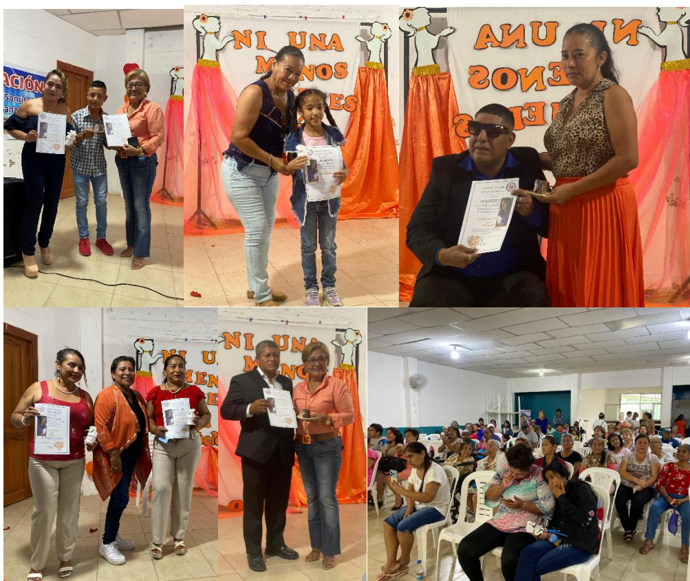
Imagen 179. Participación en el Evento "Ni una Menos" por el día Internacional de la Eliminación de la violencia contra la mujer, en la Cdla. Virgen del Carmen.