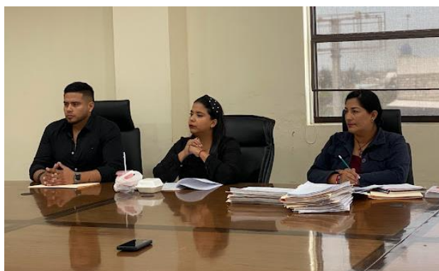
Imagen 13. Sesión Ordinaria de la Comisión de Terrenos celebrada el 25/01/2024 en la sala de sesiones.