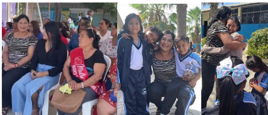
Imagen 34. Día de las madres en la escuela "Sixto Chang".