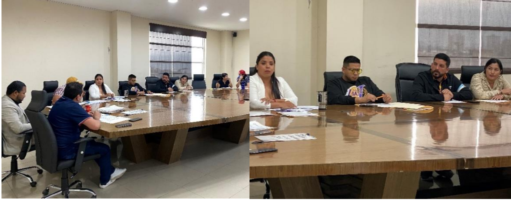
Imagen 102. Sesión Ordinaria del Gobierno Autónomo Descentralizado Municipal del Cantón La Libertad realizada el 14 de agosto del 2024, en la sala de sesiones del Palacio Municipal.