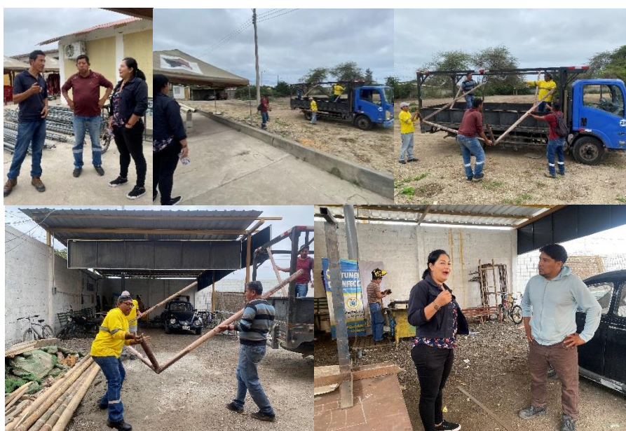
Imagen 77. Gestión para la elaboración de arcos de fútbol para el Barrio El Bosque.