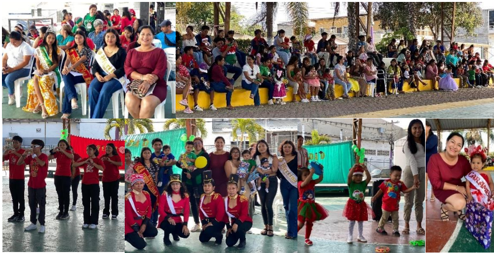
Imagen 190. Agasajo Navideño organizado por las Educadoras MIES.