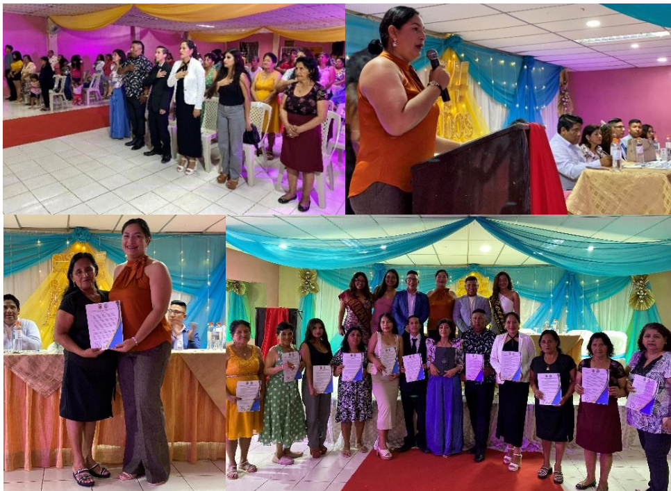
Imagen 186. Posesión de la Nueva Directiva 2024-2026 del Barrio La Esperanza.