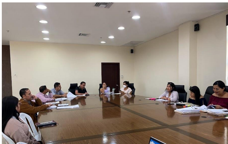
Imagen 14. Mesa de Trabajo en la sala de sesiones del Palacio Municipal.