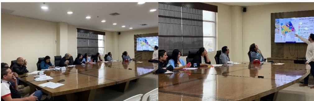
Imagen 170. Sesión Extraordinaria de Concejo realizada el 20/11/2024, en la sala de sesiones del GADMCLL.