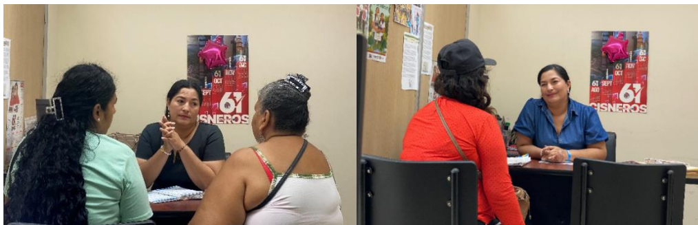
Imagen 175. Atención a usuarios en oficina de la sala de concejales 2 del GADMCLL.