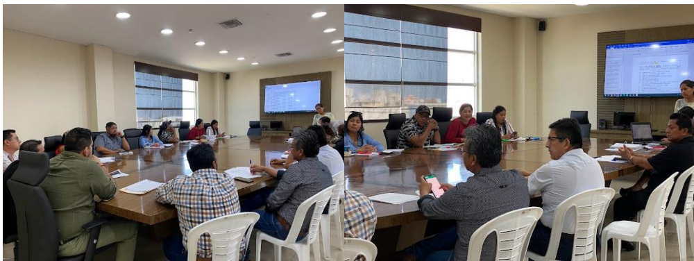
Imagen 9. Mesa de trabajo referente a la Reforma de la Ordenanza de Patente y Ordenanza de Legalización de Terrenos, en la sala de sesiones del Palacio Municipal.