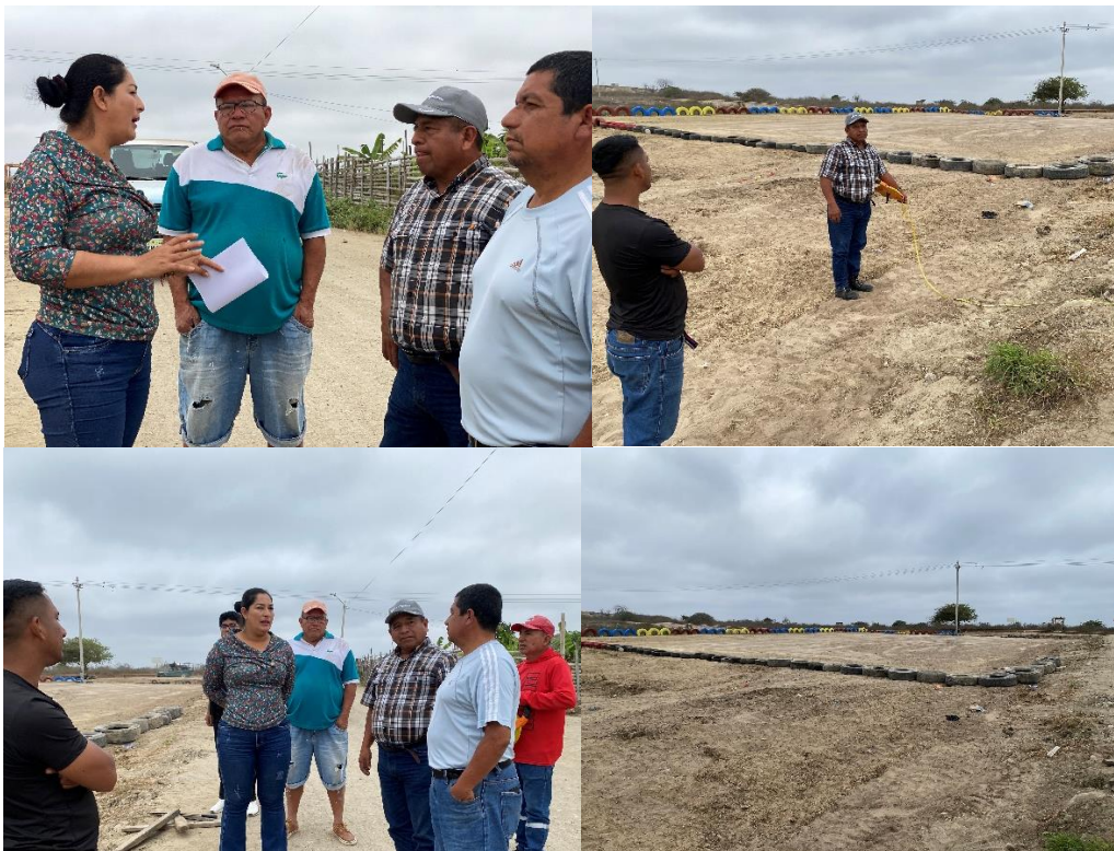
Imagen 119. Inspección INSITU en conjunto con funcionarios y técnicos del Departamento de Obras Públicas del GADMCLL el Barrio Lirios de Los Valles.