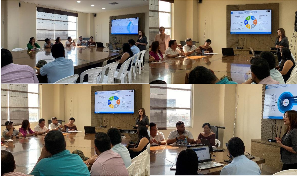
Imagen 97. Reunión de trabajo para la Elaboración del Plan de Seguridad Ciudadana y Convivencia Social Pacífica del cantón La Libertad, en la sala de sesiones del Palacio Municipal.