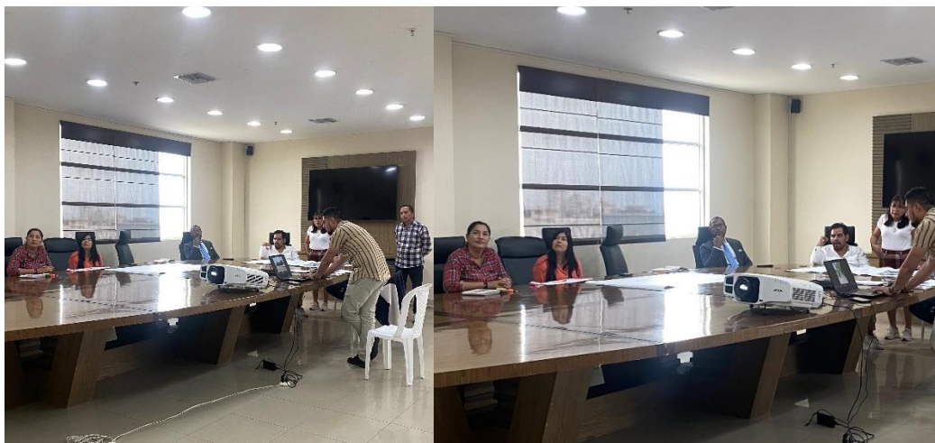
Imagen 117. Reunión de trabajo con funcionarios del Gobierno Autónomo Descentralizado Municipal del Cantón La Libertad en la sala de sesiones del Palacio Municipal.