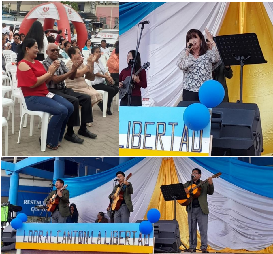
Imagen 25. Primer festival de dúos masculinos, femeninos y mixtos en homenaje a nuestro cantón La Libertad realizado en el Comercial Buenaventura Moreno.