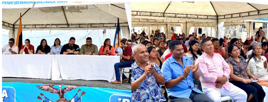
Imagen 149. Sesión Extraordinaria Itinerante del Gobierno Autónomo Descentralizado Municipal del Cantón La Libertad realizada el 30 de octubre del 2024.