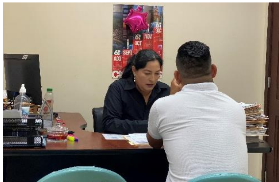
Imagen 27. Atención a usuarios en oficina de la sala de concejales 2.