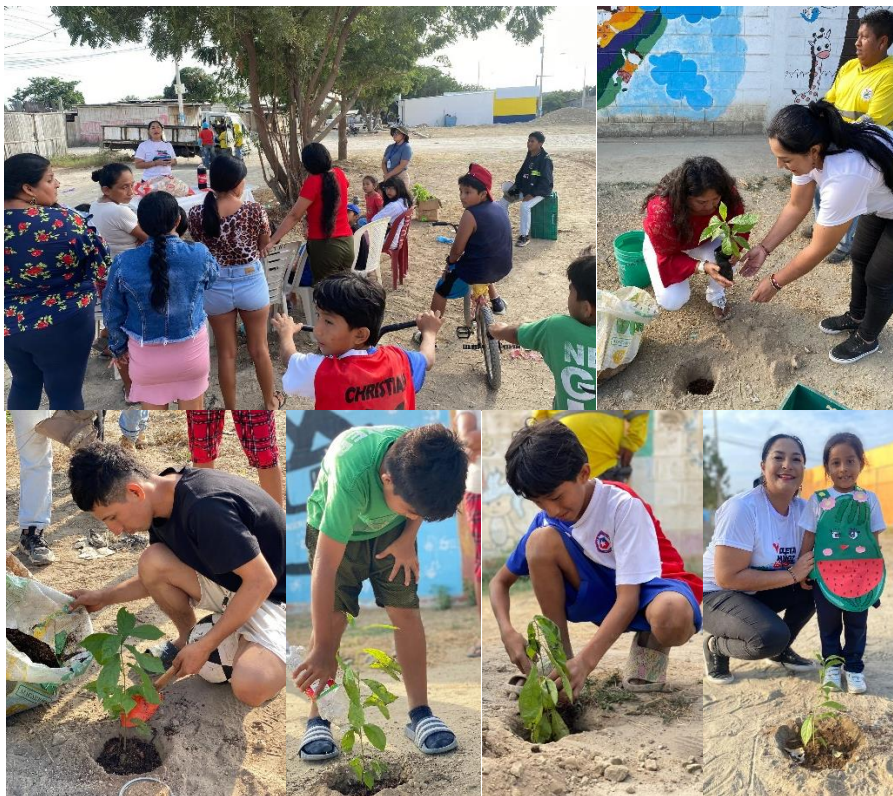
Imagen 53. Siembra de árboles en el Barrio Jaime Nebot.