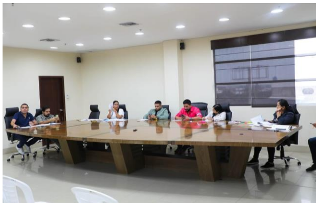
Imagen 21. Sesión Ordinaria de Concejo, en la sala de sesiones del Palacio Municipal.