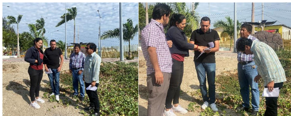
Imagen 71. Revisión INSITU de trámites de terrenos de usuarios en el sector La Previsora.