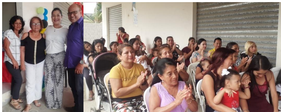
Imagen 30. Programa por el día de las madres en "Colinas de La Libertad".