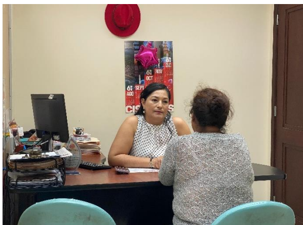
Imagen 22. Atención a usuarios en oficina de la sala de concejales 2 del GADMCLL.