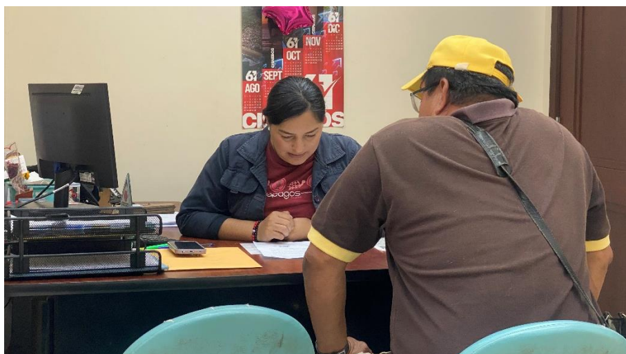
Imagen 75. Atención a usuarios en oficina de la sala de concejales 2 del Gobierno Autónomo Descentralizado Municipal del Cantón La Libertad.