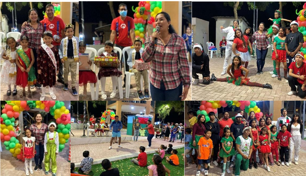
Imagen 201. Agasajo Navideño del Barrio La Previsora.