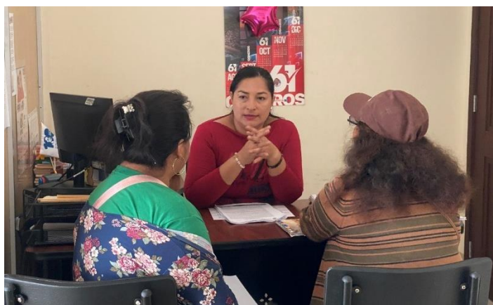
Imagen 135. Atención a usuarios en oficina de la sala de concejales 2 del GADMCLL.