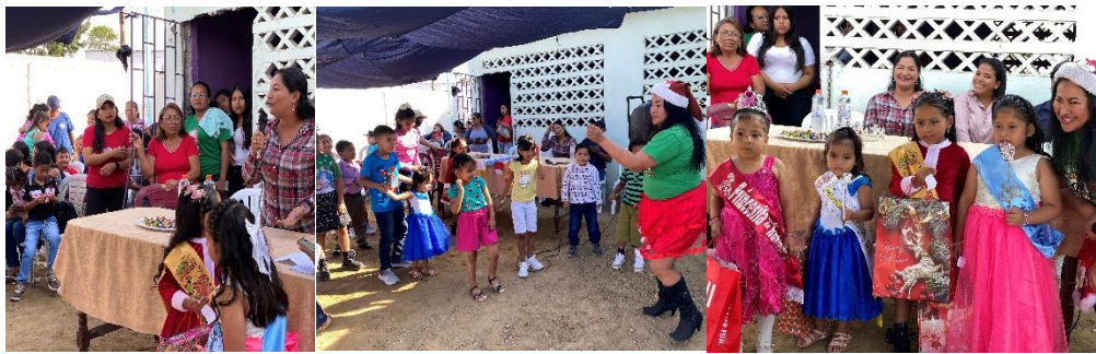
Imagen 197. Agasajo Navideño del Barrio 24 de Junio.