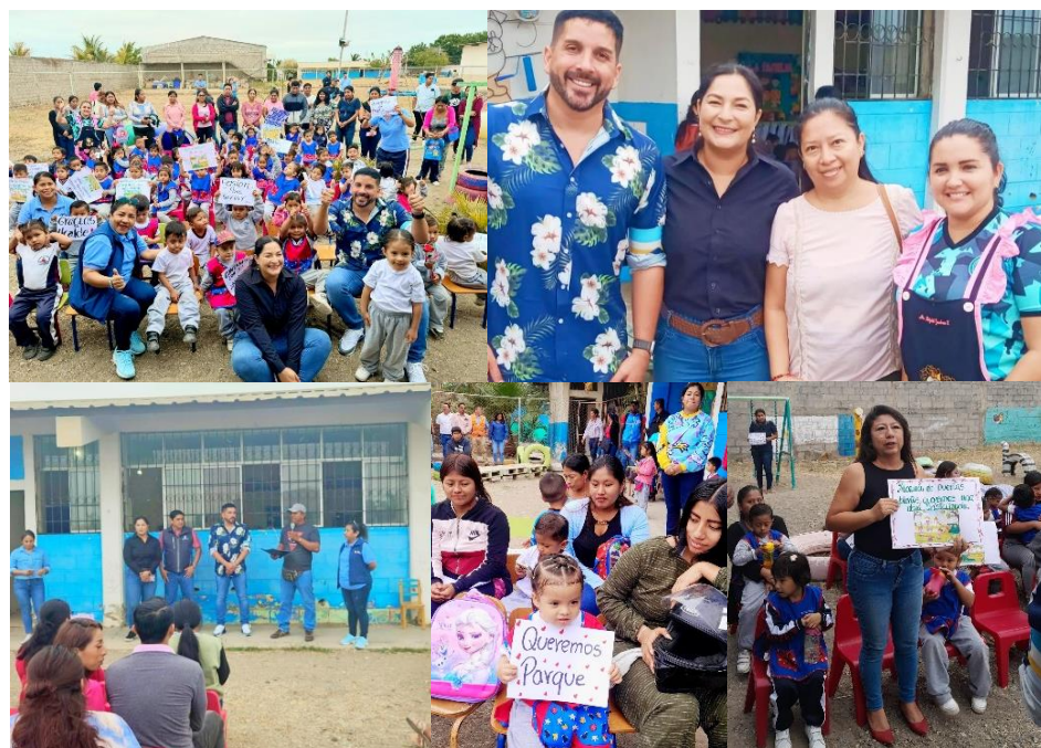
Imagen 88. Visita a la Unidad Educativa Manuela Espejo en conjunto con el señor alcalde.