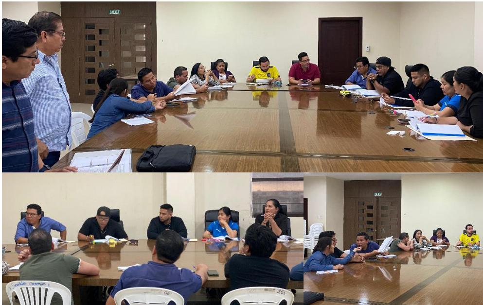
Imagen 165. Mesa de Trabajo referente a la Proforma Presupuestaria para el Ejercicio Fiscal 2025, en la sala de sesiones del Palacio Municipal.