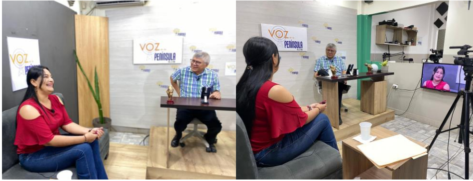
Imagen 56. Entrevista en la Radio Voz de La Península.