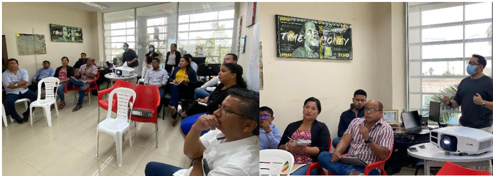
Imagen 160. Mesa de trabajo para revisar y analizar la actualización del PUGS y el PDOT.