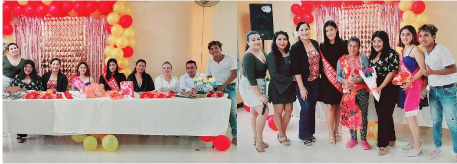
Imagen 47. Agasajo para las madres en el barrio "7de Septiembre".