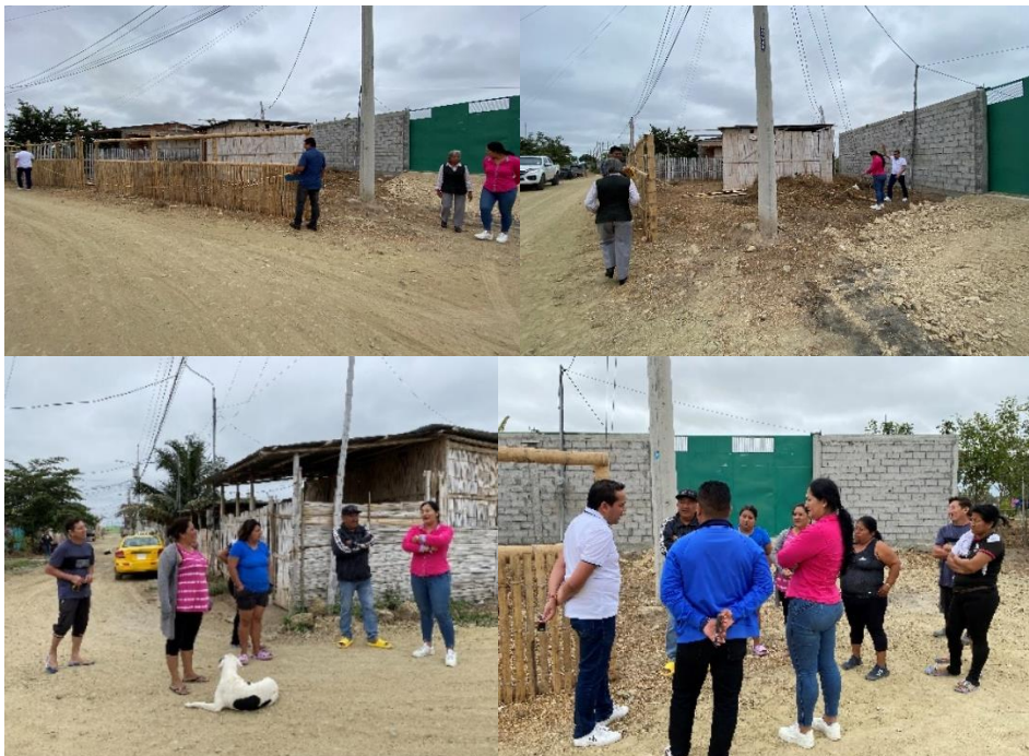
Imagen 85. Inspección IN SITU en el Barrio Santa Catalina del cantón La Libertad.