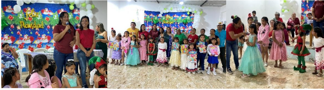
Imagen 206. Fiesta Navideña de la Ciudadela 5 de Junio.