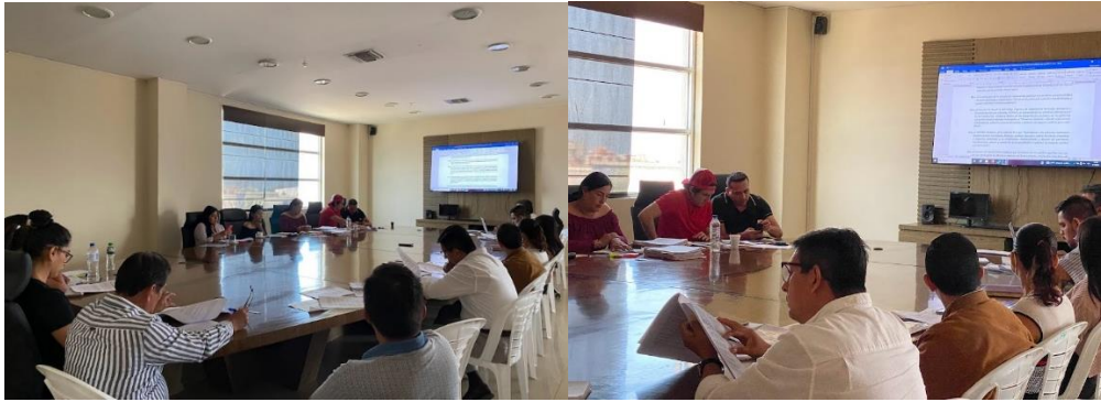
Imagen 8. Mesa de trabajo referente a la Ordenanza de Regulación, Protección, Fomento y Preservación del Arbolado Urbano e Infraestructura Verde en el Cantón La Libertad.