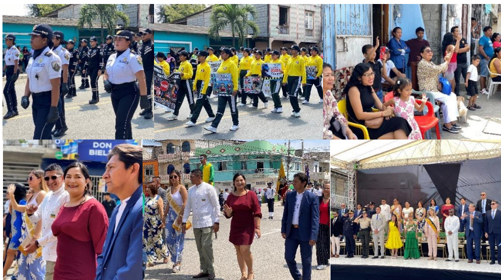
Imagen 105. Desfile cívico, militar, cultural y estudiantil.