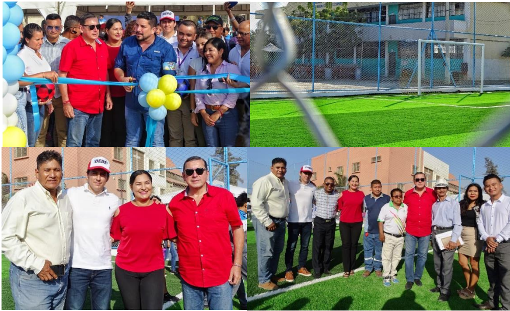
Imagen 196. Entrega de la cancha de césped sintético en la U.E. Segundo Cisneros de LaLibertad.