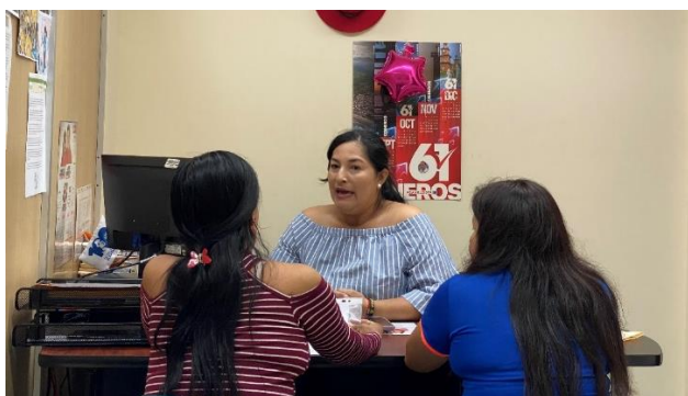
Imagen 19. Atención a usuarios en oficina de la sala de concejales 2 del GADMCLL.