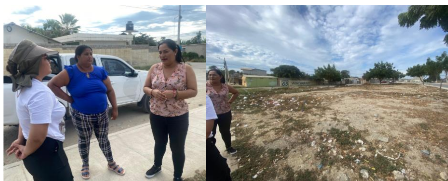
Imagen 44. Inspección INSITU en el Barrio Jaime Nebot.