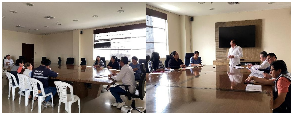
Imagen 131. Reunión de Trabajo en la Sala de Sesiones del Palacio Municipal.