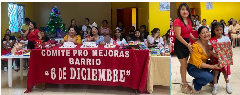
Imagen 4. Fiesta Navideña del Barrio 6 de Diciembre.