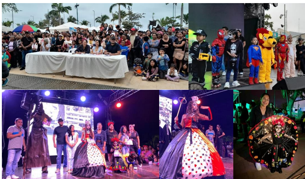
Imagen 145. Concurso de disfraces en el parque de La Libertad.