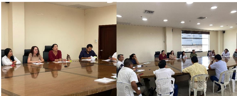
Imagen 187. Mesa de trabajo sobre Proyecto de Ordenanza de Motocicletas, en la sala de sesiones del GADMCLL.