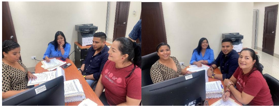
Imagen 70. Sesión Ordinaria de la Comisión Ocasional de Terrenos celebrada el 26 de junio del 2024.