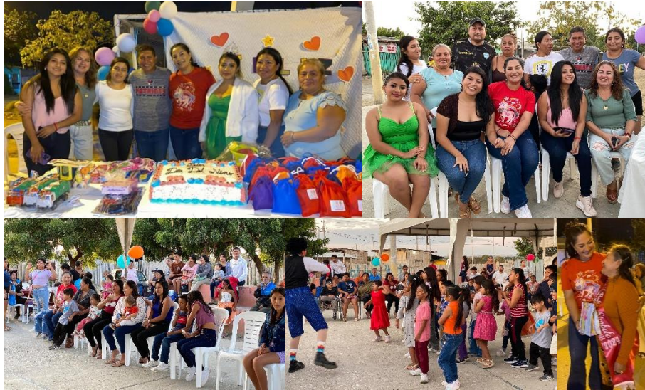
Imagen 50. Fiesta infantil en el Barrio Virgen Inmaculada.