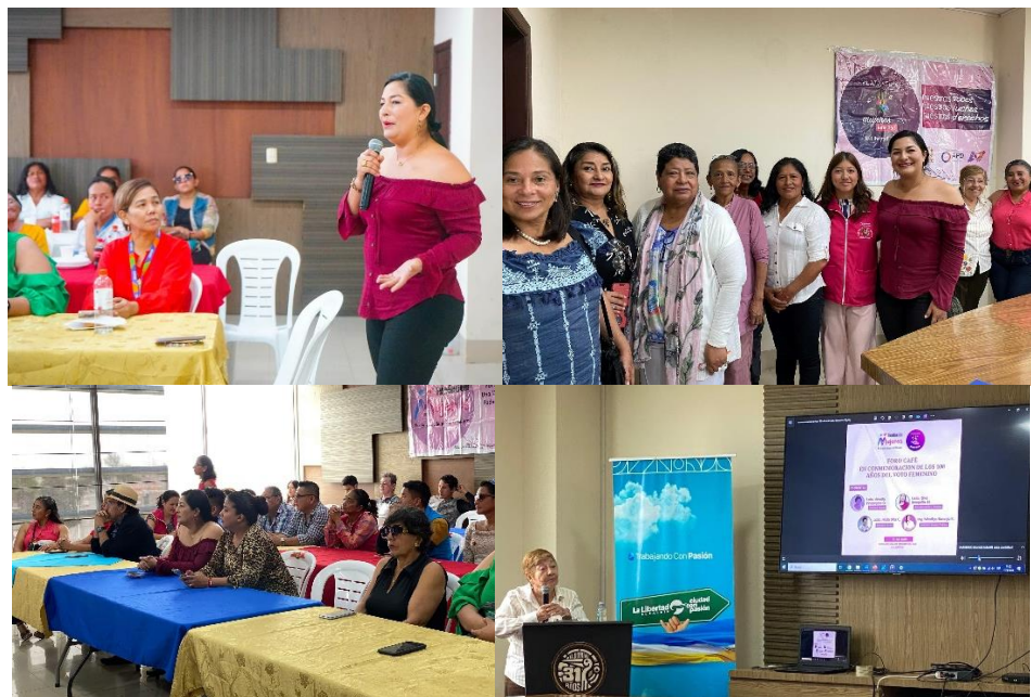
Imagen 58. Foro organizado por Fundación Mujeres por la Paz del Ecuador y la participación de Plataforma Mujeres igualdad Santa Elena.