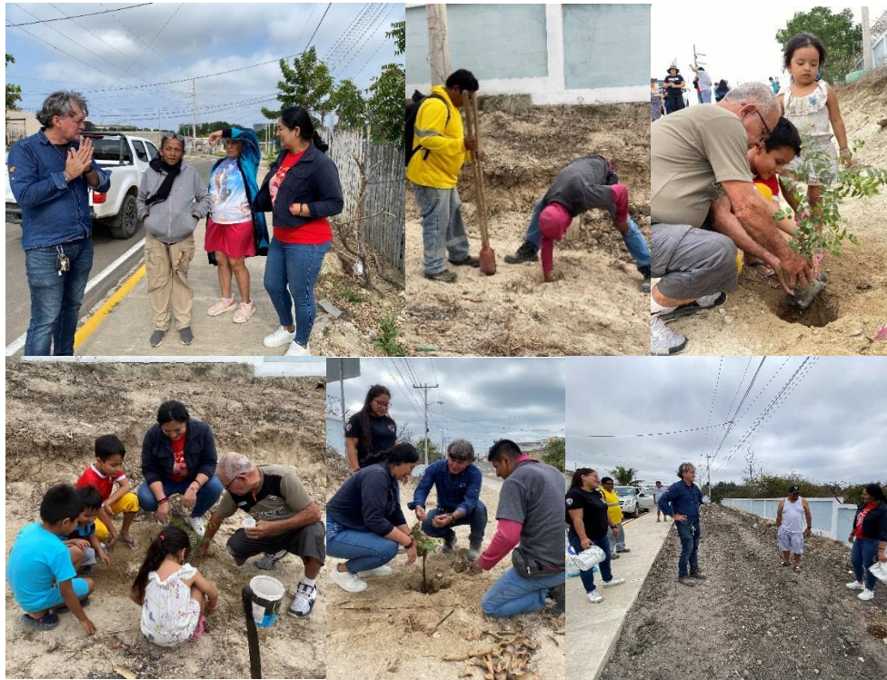
Imagen 122. Siembra de árboles en el Barrio Las Colinas en conjunto con los moradores del sector y el Departamento de Higiene y Ambiente del GADMCLL.