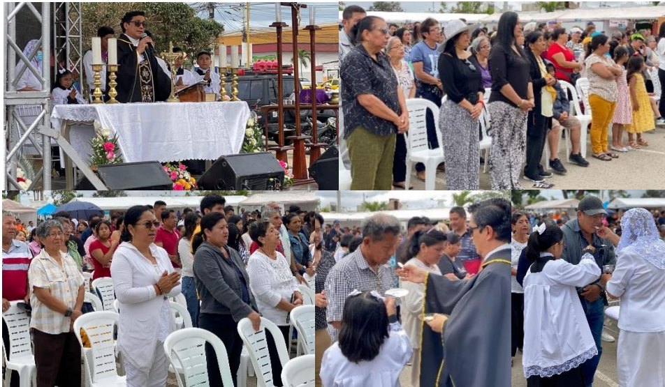
Imagen 152. Misa por el Día de Difuntos en la explanada del Cementerio General de La Libertad.