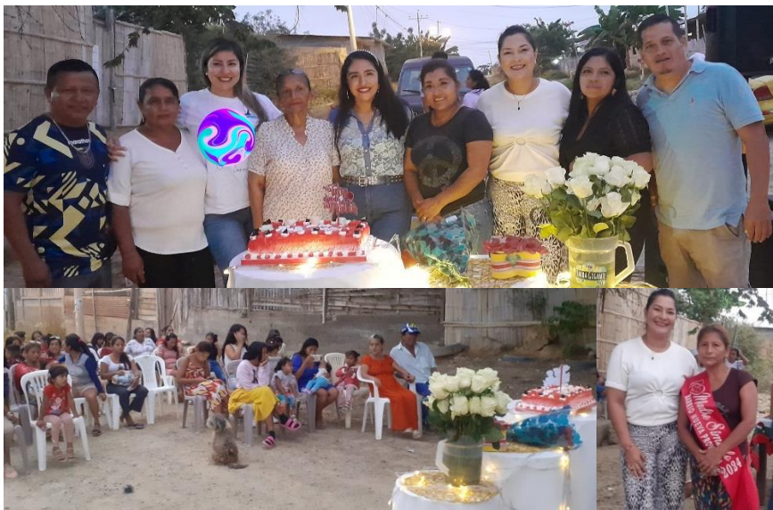
Imagen 33. Día de las madres del Barrio "Nueva Provincia"