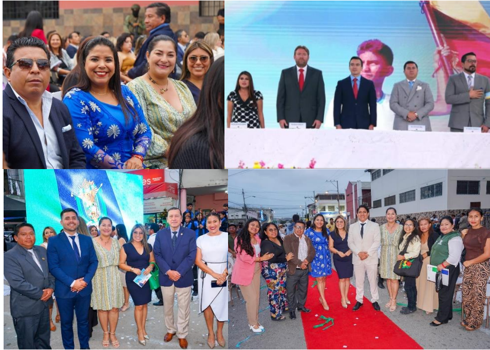
Imagen 159. Sesión Solemne por conmemorarse el décimo séptimo aniversario de provincialización de Santa Elena.