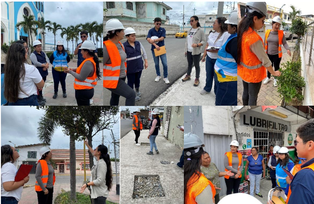
Imagen 107. Visita en sitio en el sector 1 del proyecto de Rehabilitación Vial de la CAF.