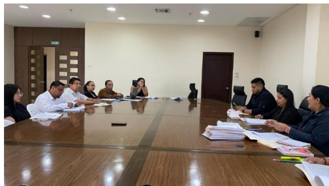
Imagen 5. Mesa de trabajo referente a la Ordenanza de Arbolado Urbano del Cantón La Libertad.