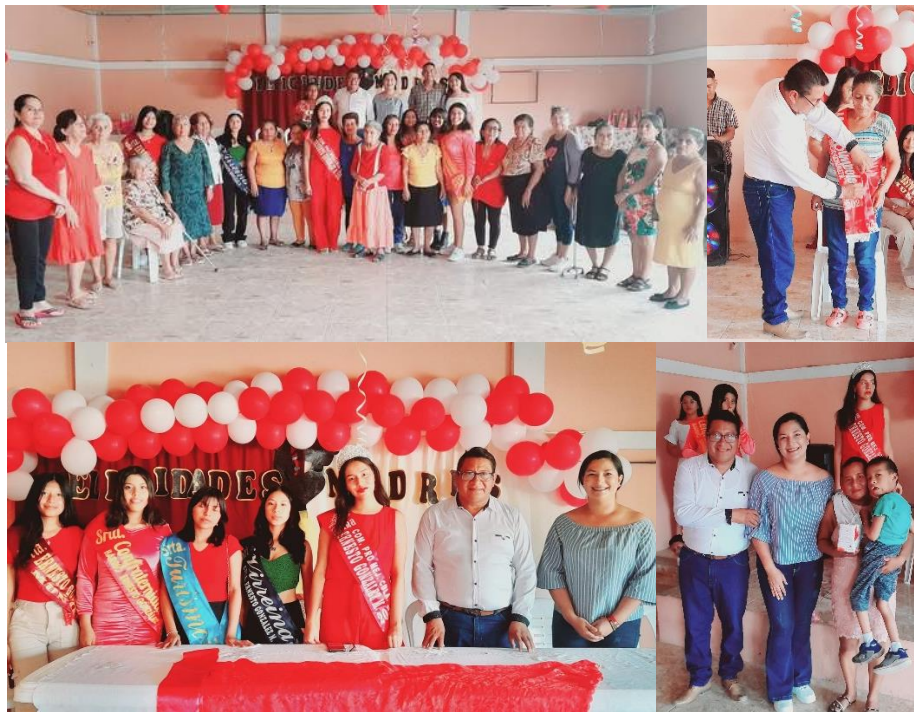
Imagen 42. Día de las madres en el Barrio "Ernesto Gonzalez"