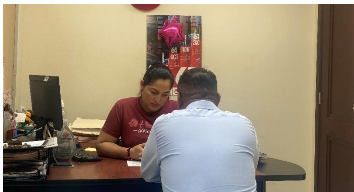
Imagen 67. Atención a usuarios en oficina de la sala de concejales 2 del GADMCLL.