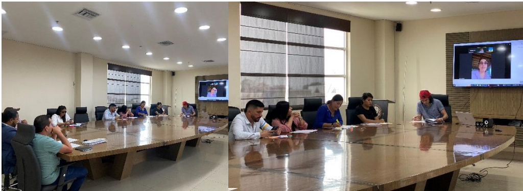
Imagen 99. Sesión Extraordinaria del Gobierno Autónomo Descentralizado Municipal del Cantón La Libertad realizada el 30 de julio del 2024, en la sala de sesiones del Palacio Municipal.