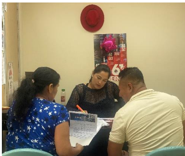
Imagen 15. Atención a usuarios en oficina de la sala de concejales 2.