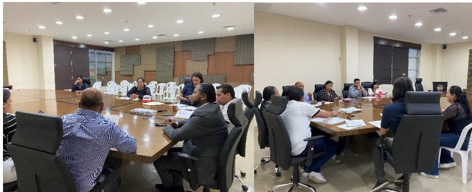
Imagen 87. Sesión Ordinaria de Concejo realizada el 12 de julio del 2024, en la sala de sesiones del GADMCLL.