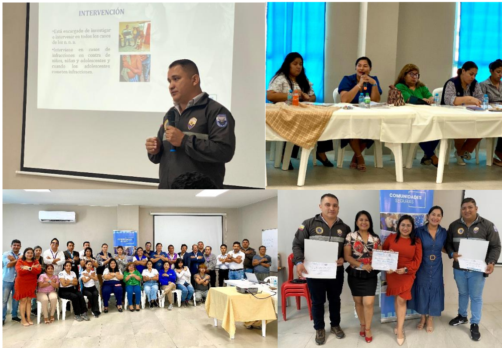
Imagen 178. Participación en el Evento "¡Oye Tú! me importas", en el Auditorio del centro gerontológico municipal del Barrio 5 de Junio.