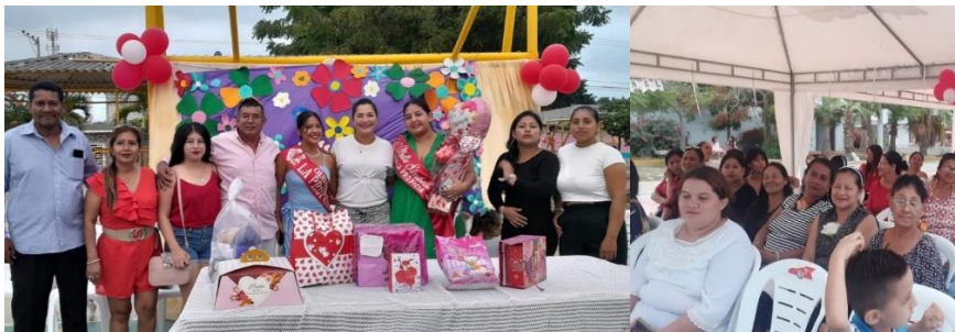
Imagen 32. Día de las madres del Barrio "La Propicia".