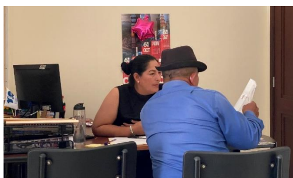
Imagen 181. Atención a usuarios en oficina de la sala de concejales 2 del GADMCLL.