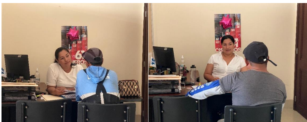
Imagen 188. Atención a usuarios en oficina de la sala de concejales 2 del GADMCLL.