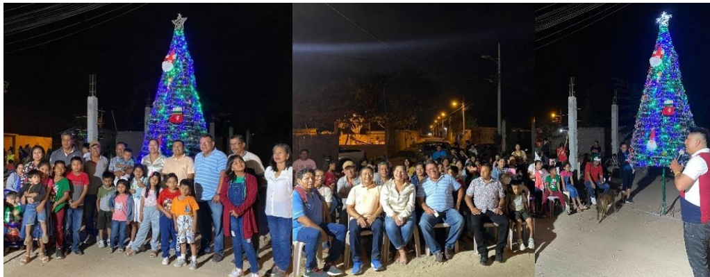
Imagen 191. Encendida del árbol en el barrio Los Ceibos.