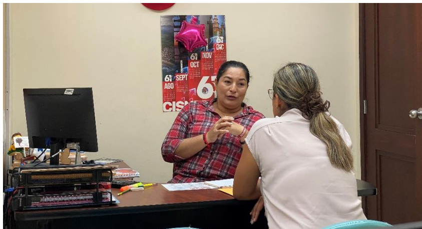
Imagen 127. Atención a usuarios en oficina de la sala de concejales 2 del GADMCLL.