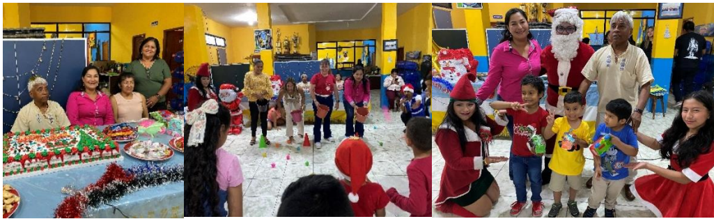
Imagen 203. Fiesta Navideña de la Liga Deportiva Cantonal de La Libertad.