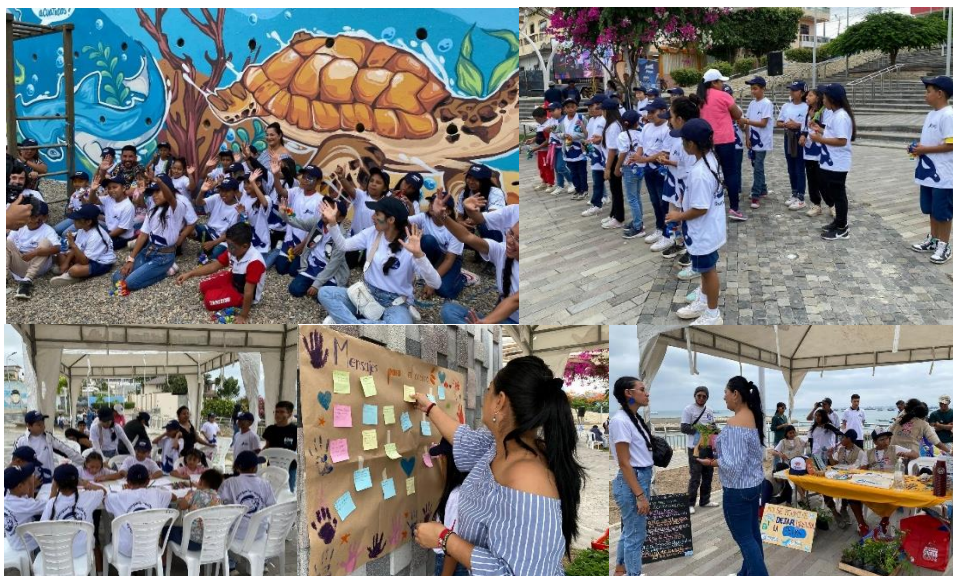
Imagen 54. Mural ubicado en el Mirador de La Caleta por el Día Mundial de los Océanos.