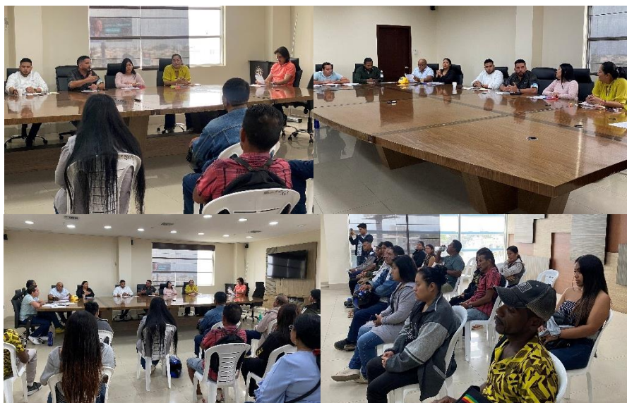
Imagen 81. Sesión Ordinaria del Gobierno Autónomo Descentralizado Municipal del Cantón La Libertad realizada el 5 de julio del 2024, en la sala de sesiones del Palacio Municipal.