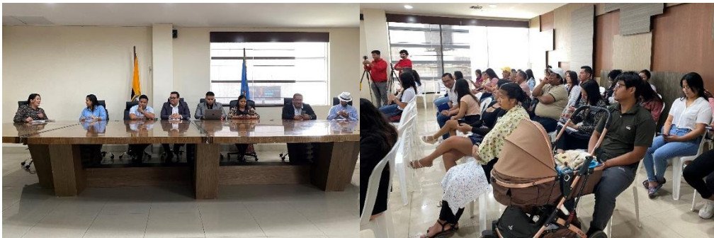
Imagen 114. Participación en la Firma de Acuerdo con el Instituto Tecnológico Universitario Espíritu Santo para Becas Universitarias.