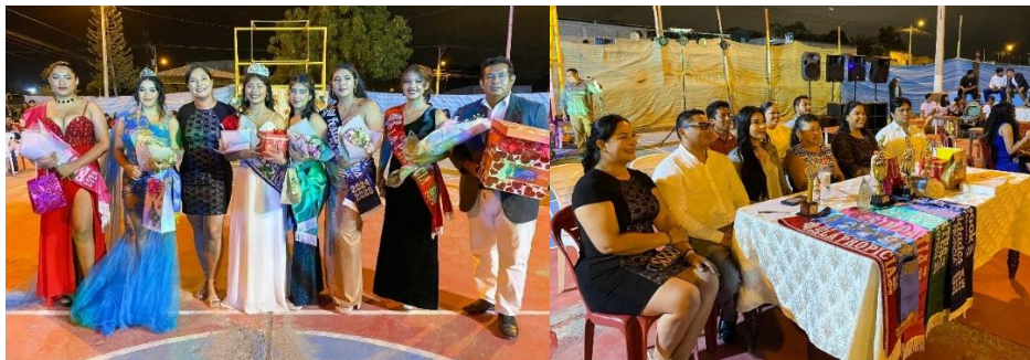
Imagen 74. Elección de la reina en la Ciudadela La Propicia.