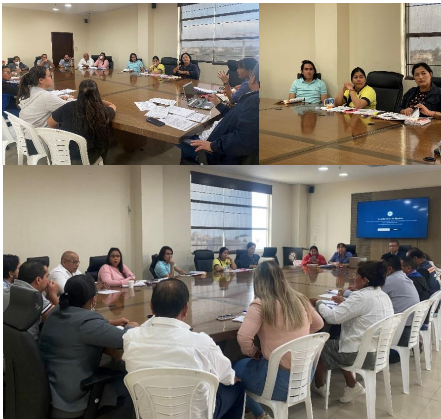
Imagen 80. Mesa de trabajo referente a la Reforma a la Ordenanza que Regula el Arrendamiento y Compraventa de Terrenos de Propiedad Municipal