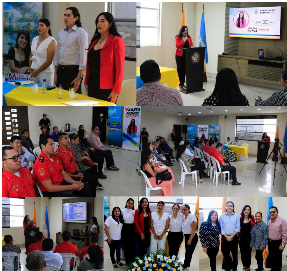
Imagen 41. Rendición de Cuentas correspondientes al año 2023.