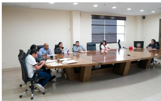
Imagen 20. Sesión Ordinaria de Concejo, en la sala de sesiones del Palacio Municipal.