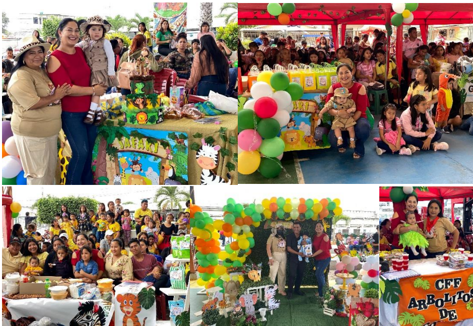
Imagen 65. FIESTA SAFARI organizada para celebrar Día del Niño.