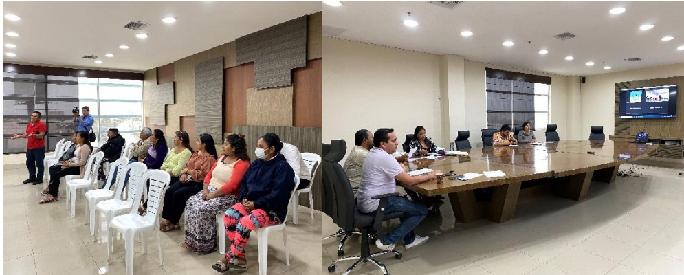
Imagen 109. Sesión Ordinaria del Gobierno Autónomo Descentralizado Municipal del Cantón La Libertad realizada el 22 de agosto del 2024, en la sala de sesiones del Palacio Municipal.