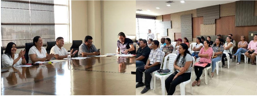
Imagen 189. Sesión Ordinaria de Concejo realizada el 13 de diciembre del 2024, en la sala de sesiones del GADMCLL.