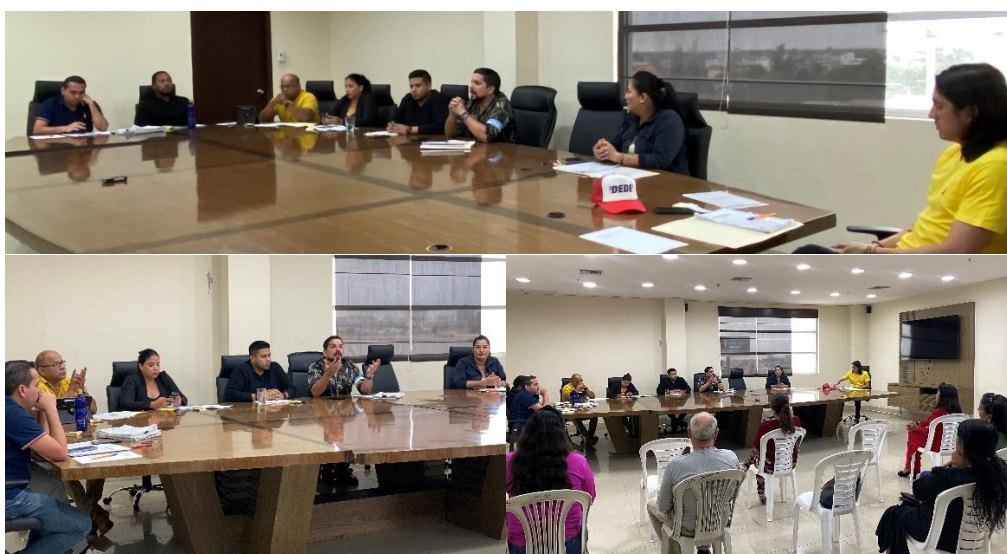
Imagen 136. Sesión Ordinaria del Gobierno Autónomo Descentralizado Municipal del Cantón La Libertad realizada el 18 de octubre del 2024, en la sala de sesiones del Palacio Municipal.