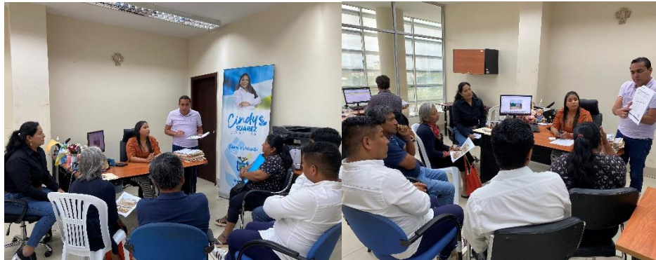
Imagen 84. Reunión con moradores de Barrio Santa Catalina en oficinas de sala de concejales del GADMCLL.