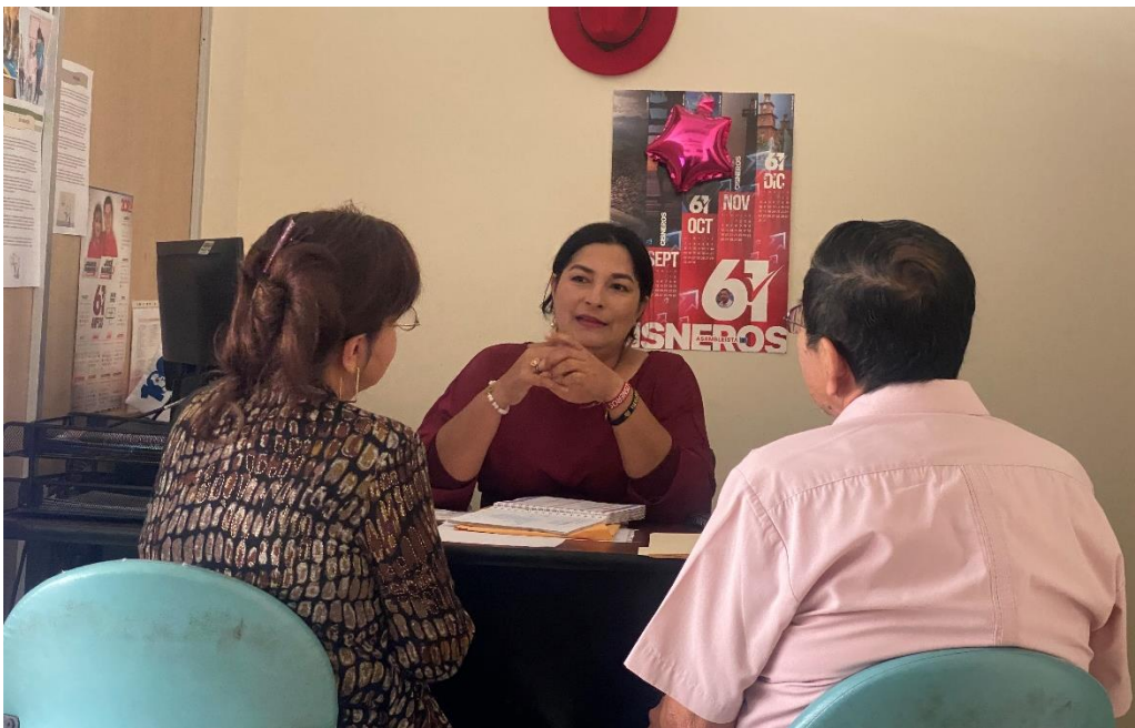
Imagen 134. Atención a usuarios en oficina de la sala de concejales 2 del Gobierno Autónomo Descentralizado Municipal del Cantón La Libertad.