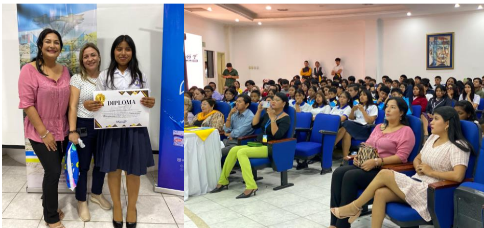
Imagen 63. Concurso de Oratoria en el auditorio de la UPSE.