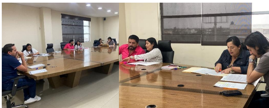
Imagen 78. Sesión Extraordinaria del Gobierno Autónomo Descentralizado Municipal del Cantón La Libertad realizada el 2 de julio del 2024, en la sala de sesiones del Palacio Municipal.