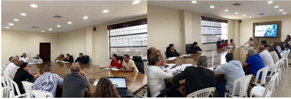
Imagen 138. Mesa de trabajo con representantes de La Cámara de Comercio y Cámara de Producción para socializar la ordenanza de Patentes, en la sala de sesiones del GADMCLL.