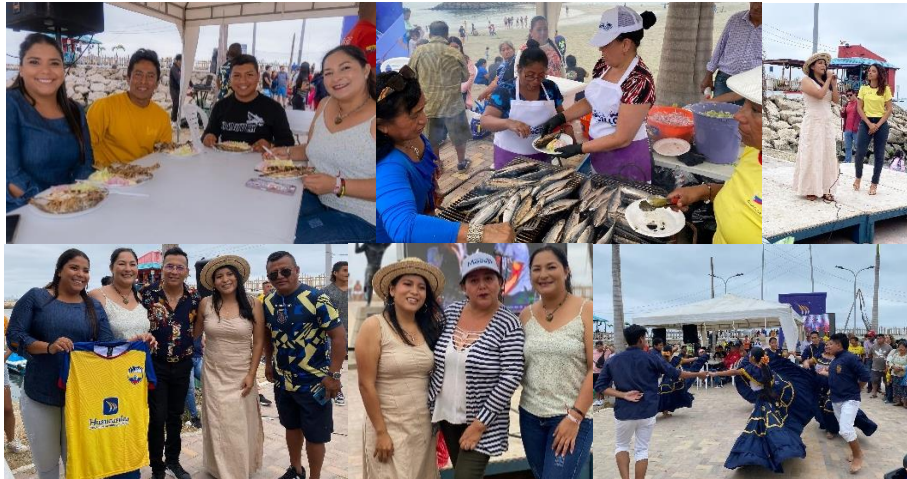
Imagen 72. Primer festival del pescado asado "DEL MAR A SU MESA".