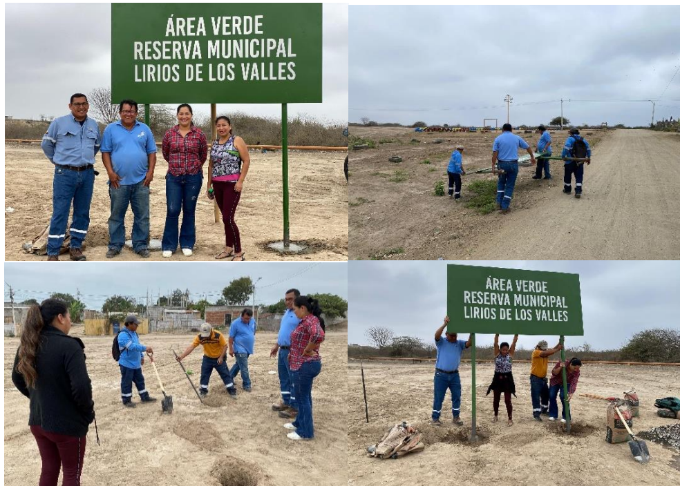
Imagen 143. Colocación del letrero de identificación en la Reserva Municipal Lirio de los Valles, en conjunto con moradores de los Ceibos y Lirios de los Valles.