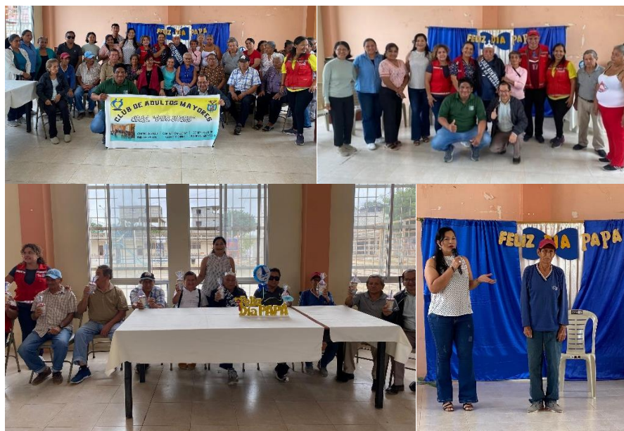
Imagen 76. Día del Padre organizado por el Proyecto Social de Prefectura de Adultos Mayores en la Ciudadela "6 De Enero".