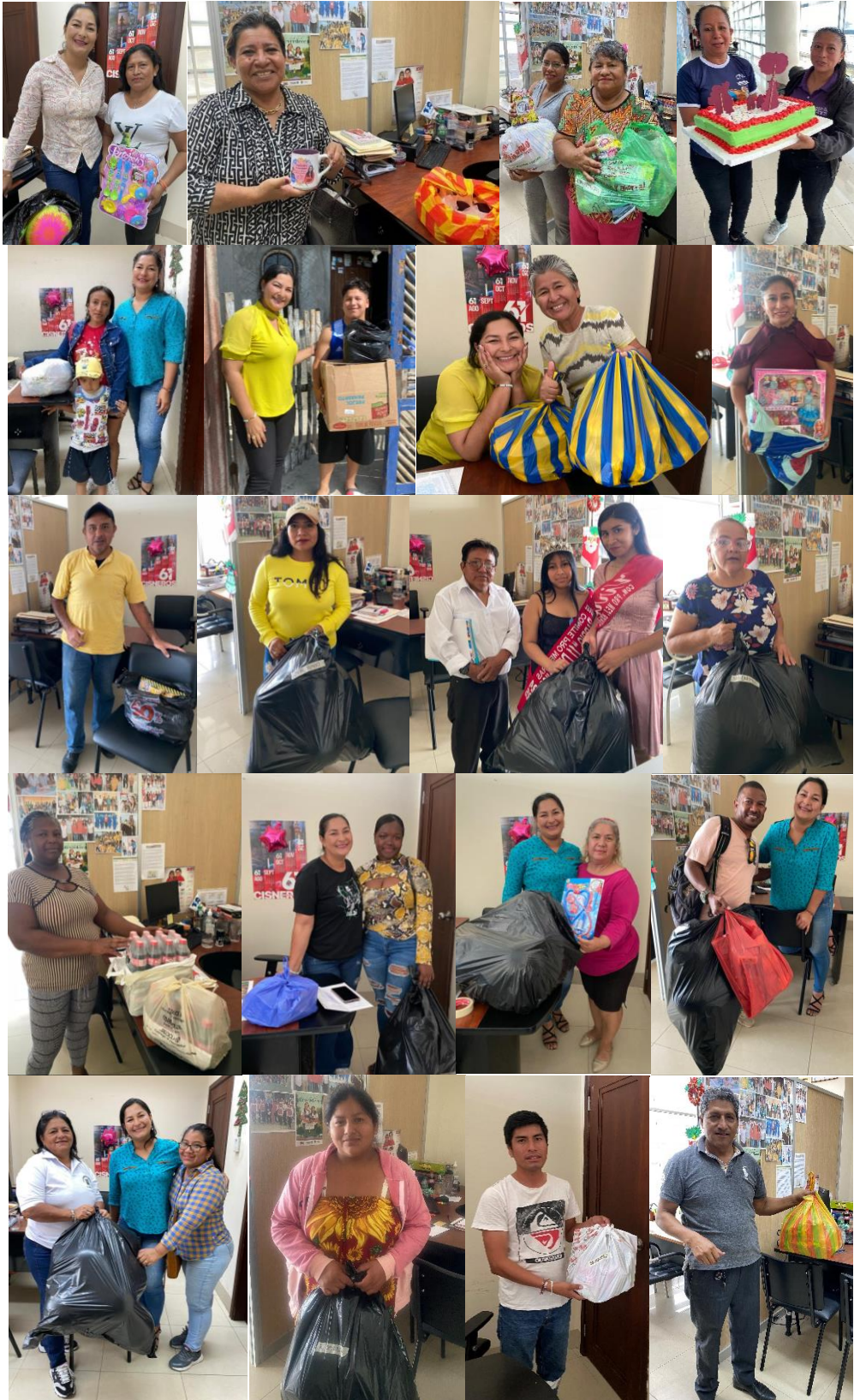
Imagen 208. Apoyo con donaciones para las actividades que realizan los diferentes Barrios del Cantón La Libertad.