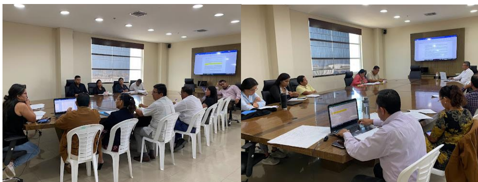
Imagen 12. Mesas de trabajo referente a la Ordenanza de Regulación, Protección, Fomento y Preservación del Arbolado Urbano e Infraestructura Verde en el Cantón La Libertad