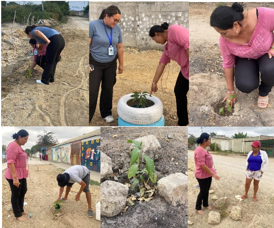
Imagen 62. Inspección de los árboles plantados en los diferentes Barrios del cantón La Libertad.