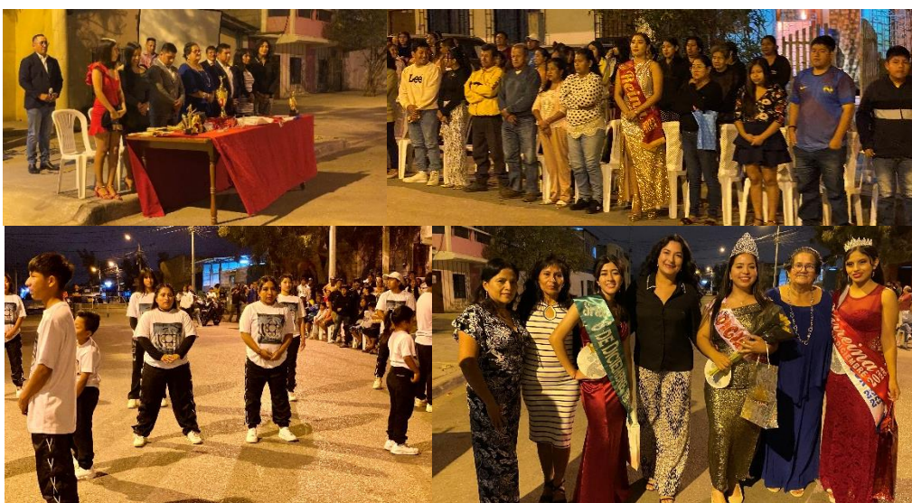
Imagen 184. Elección de Reina por el aniversario 50 del Barrio 6 de diciembre.