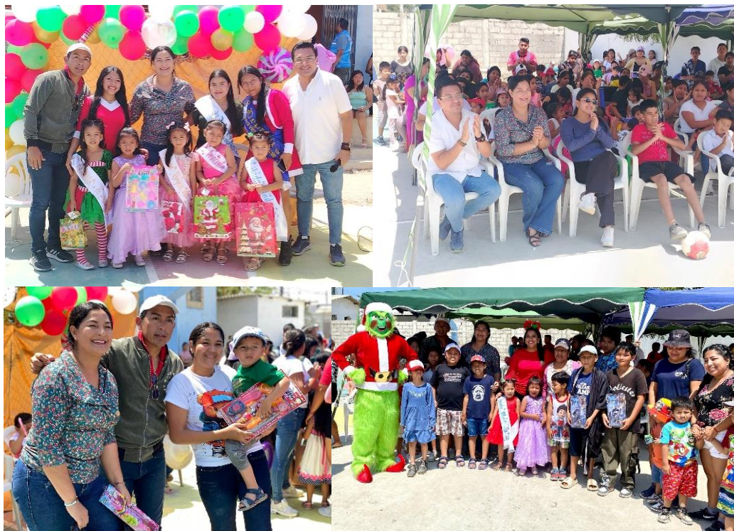
Imagen 194. Agasajo Navideño en la ciudadela Virgen del Cisne.