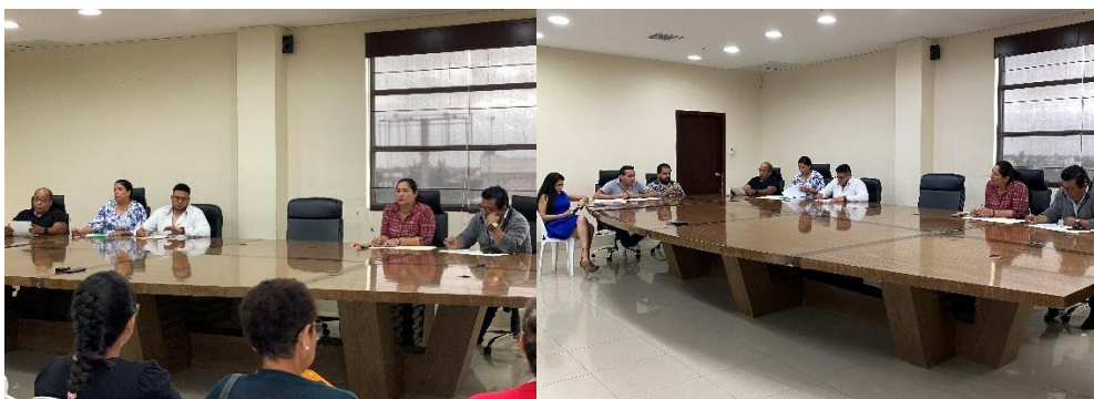
Imagen 144. Sesión Ordinaria de Concejo realizada el 24 de octubre del 2024, en la sala de sesiones.