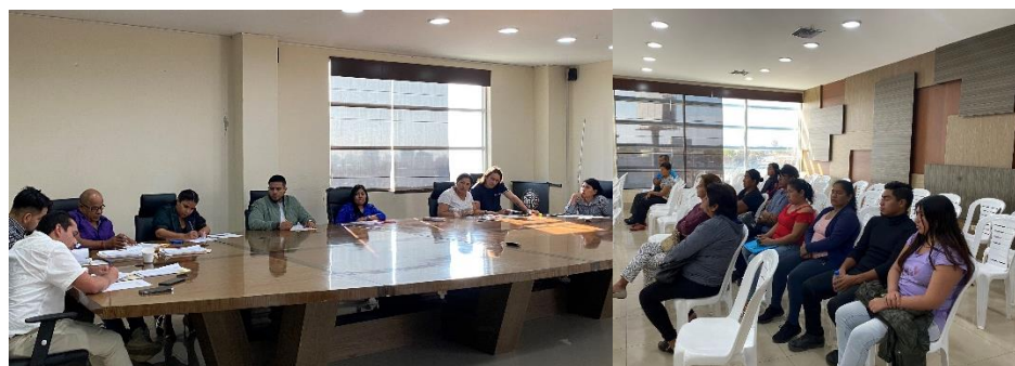
Imagen 91. Sesión Ordinaria de Concejo realizada el 18 de julio del 2024, en la sala de sesiones del GADMCLL.