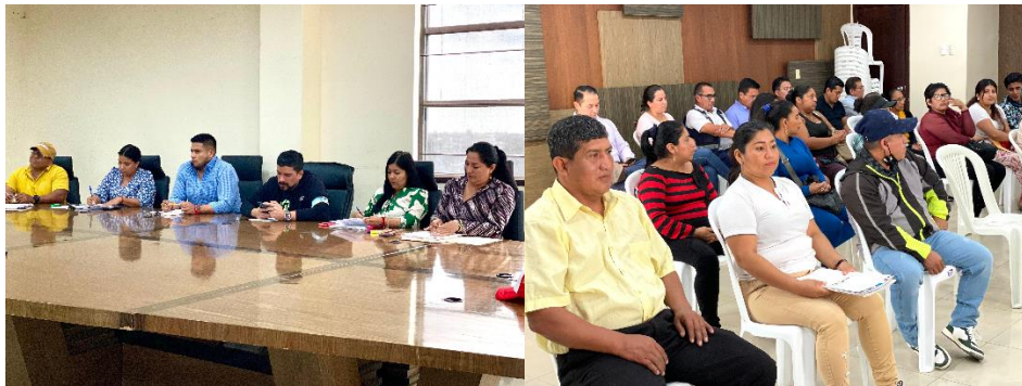
Imagen 157. Sesión Ordinaria de Concejo realizada el 6 de noviembre del 2024, en la sala de sesiones del Palacio Municipal.