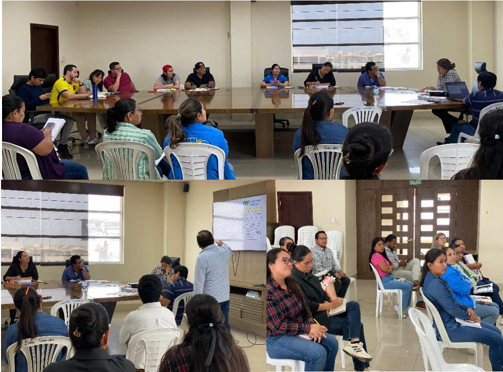
Imagen 164. Reunión de Trabajo con funcionarios y directores del GADMCLL en la sala de sesiones.