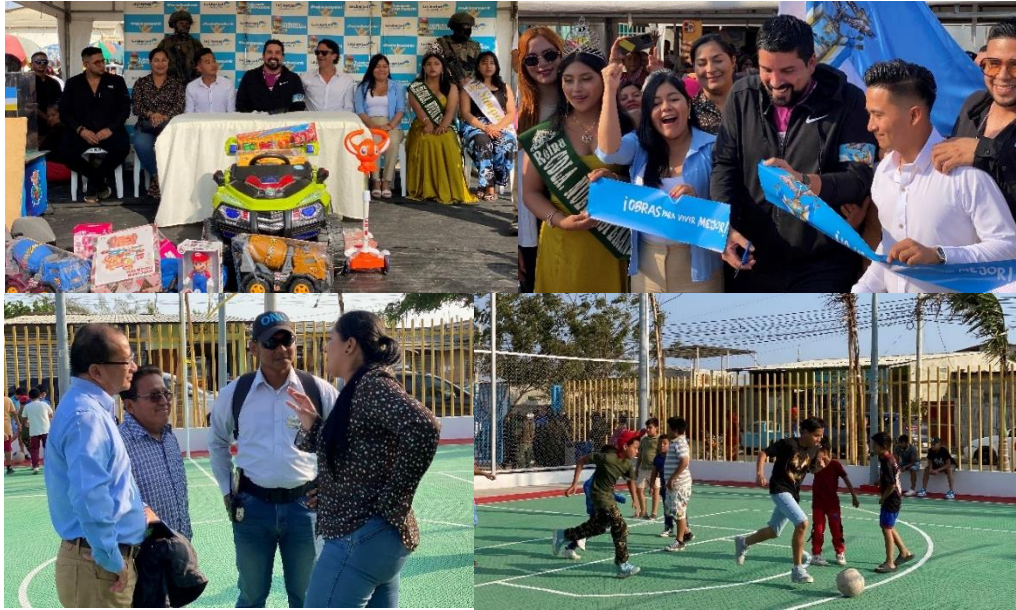
Imagen 171. Inauguración del Parque recreativo de la Ciudadela Nueva Esperanza.