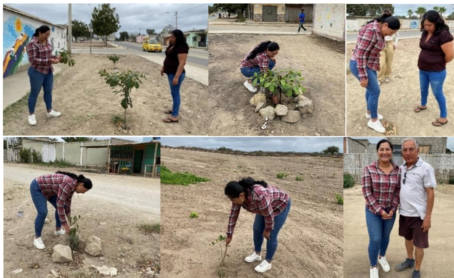
Imagen 140. Seguimiento de siembra de árboles en los sectores del cantón La Libertad.