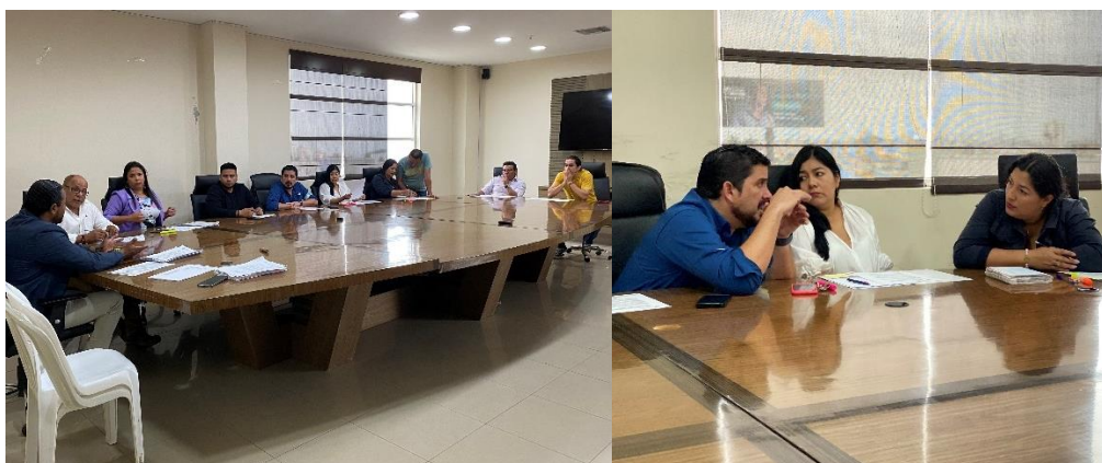
Imagen 180. Sesión Ordinaria de Concejo realizada el 2 de diciembre del 2024, en la sala de sesiones del Gobierno Autónomo Descentralizado Municipal del Cantón La Libertad.