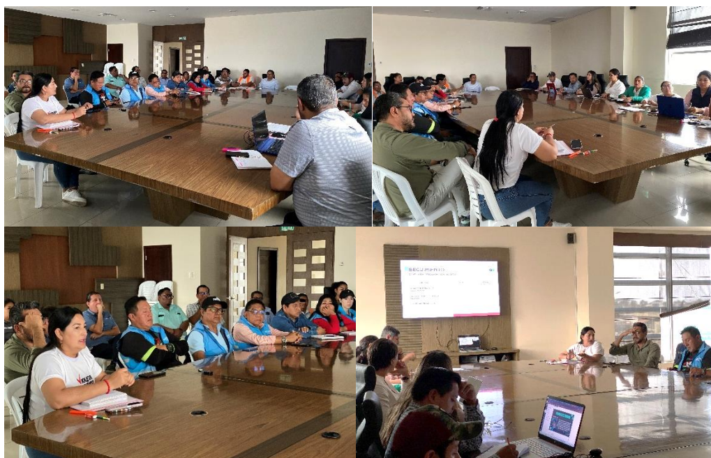
Imagen 132. Sexta Mesa Técnica Articulada CAF sobre el paquete de obras viales del Programa de Infraestructura Urbana del Cantón La Libertad.