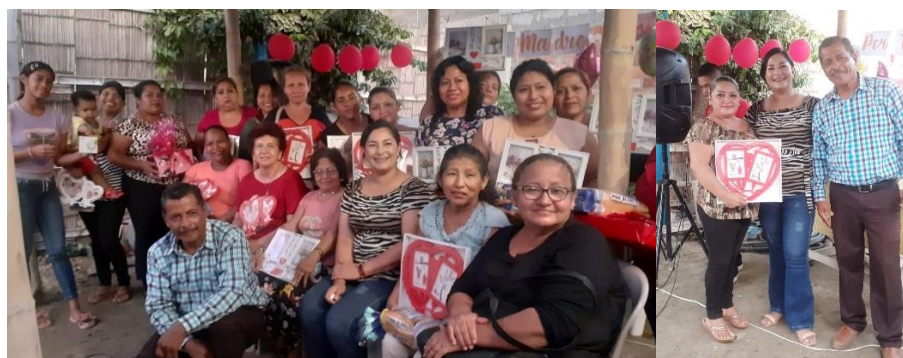
Imagen 46. Día de la madre en el Barrio "El Mirador".