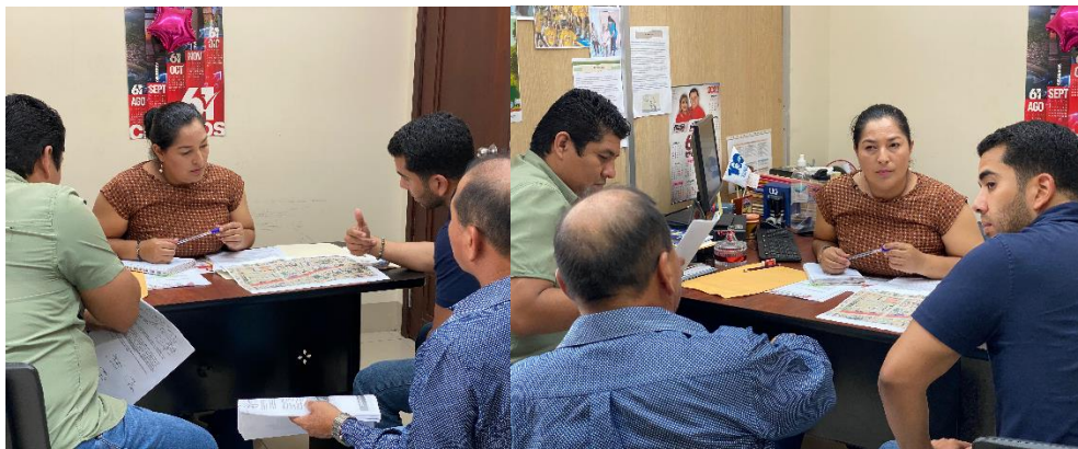
Imagen 161. Reunión con el departamento de Planificación y Obras Públicas del GADMCLL.