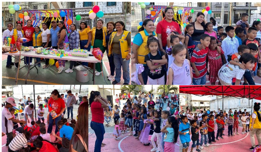
Imagen 49. Día del niño realizado por El Club de Leones La Libertad - Guancavilca.