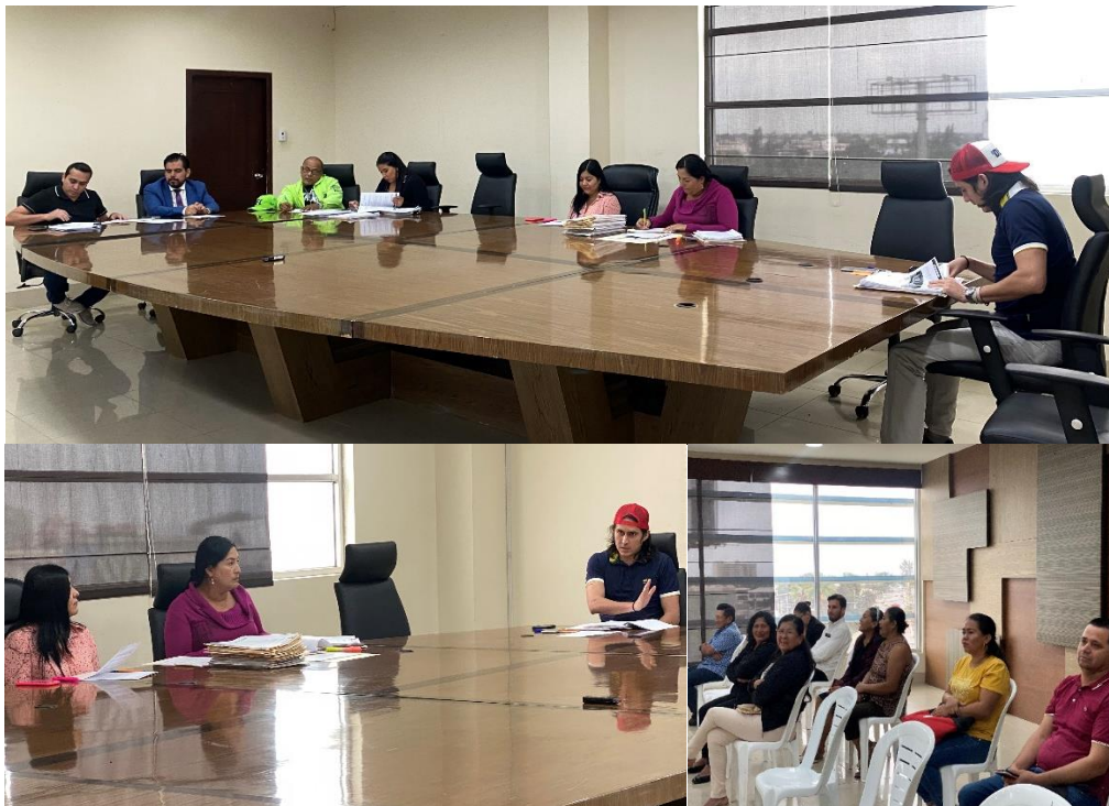
Imagen 121. Sesión Ordinaria del Gobierno Autónomo Descentralizado Municipal del Cantón La Libertad realizada el 5 de septiembre del 2024, en la sala de sesiones del Palacio Municipal.