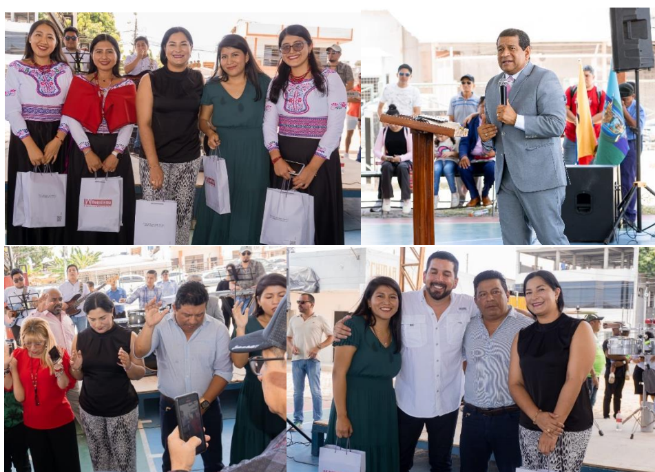
Imagen 23. Evento realizado en honor a los 31 años de Cantonización de La Libertad con el día de la Biblia y la oración.