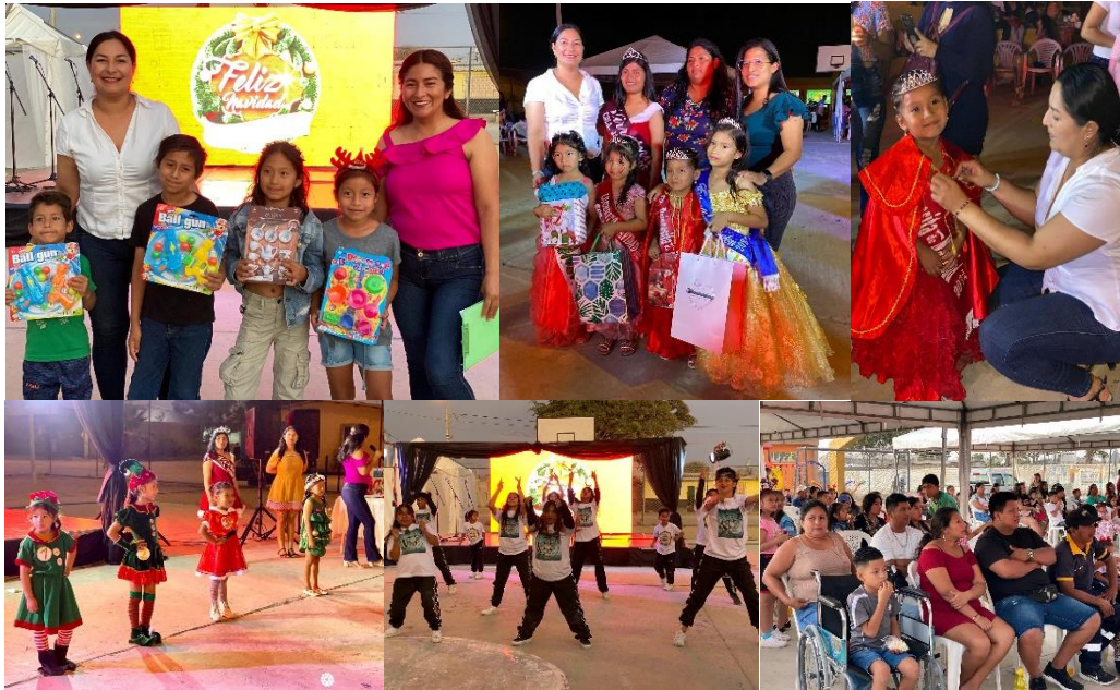
Imagen 193. Programa navideño en el barrio Jaime Nebot.