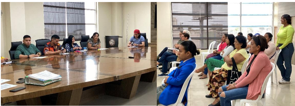
Imagen 101. Sesión Ordinaria del Gobierno Autónomo Descentralizado Municipal del Cantón La Libertad realizada el 1 de agosto del 2024, en la sala de sesiones del Palacio Municipal.