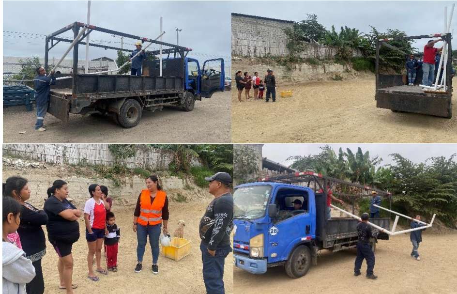
Imagen 86. Entrega de la donación de los arcos de futbol para el Barrio El Bosque del Cantón La Libertad.