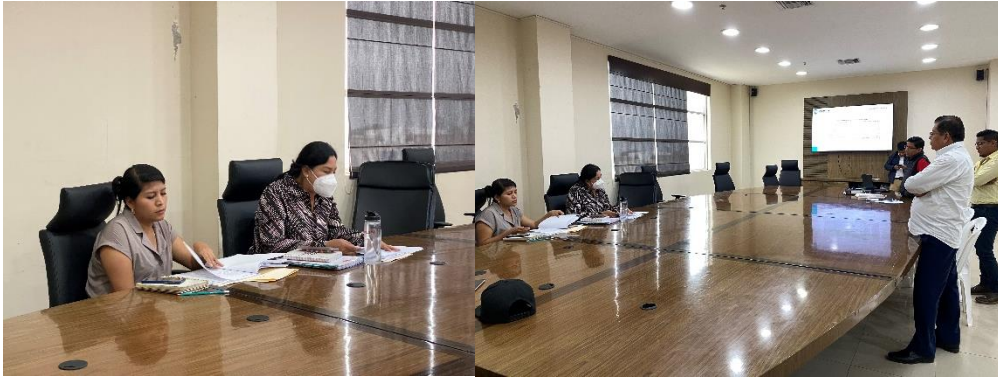
Imagen 110. Mesa de trabajo en la sala de sesiones del Palacio Municipal.