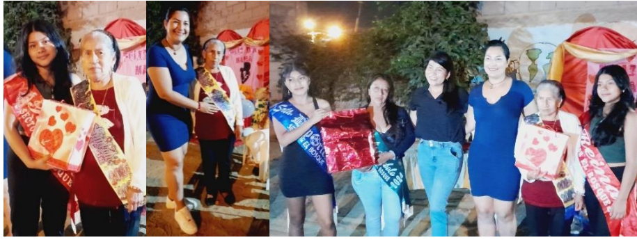
Imagen 38. Día de las madres de "El Bosque".