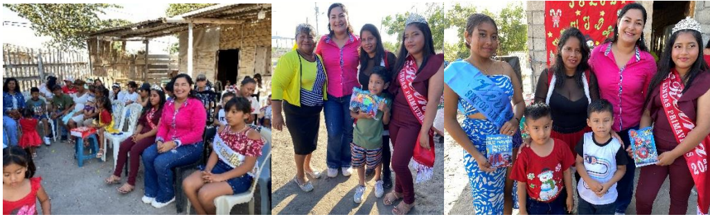
Imagen 202. Agasajo Navideño del Barrio Tierras Lindas Primavera.