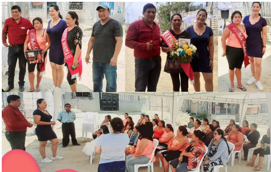
Imagen 37. Agasajo para las madres de "Santa Catalina".