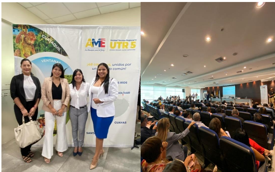
Imagen 26. Participación en el taller organizado por la AME y la Contraloría General del Estado.