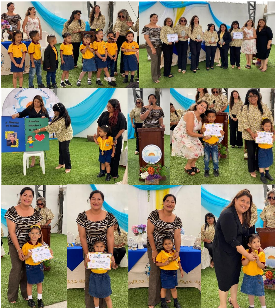
Imagen 155. Sesión Solemne por el aniversario 38 del Centro de Educación Inicial "Rosa Álava de Vicuña".