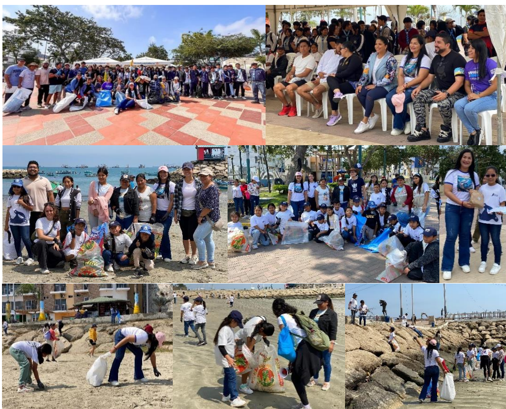
Imagen 130. Limpieza de playas en el malecón de La Libertad.