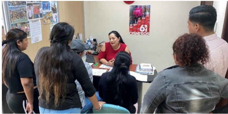
Imagen 61. Atención a usuarios en oficina de la sala de concejales 2.