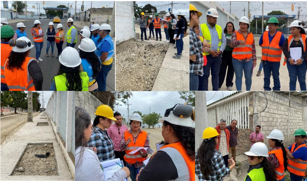
Imagen 111. Visita en sitio referente a la rehabilitación vial del cantón la libertad, en el sector 1, de acuerdo a los parámetros y lineamientos técnicos dispuestos por la CAF.