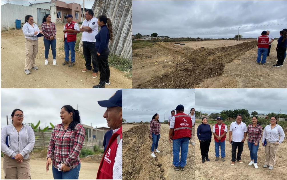
Imagen 106. Visita INSITU al Barrio Lirios de los Valles con el departamento de Higiene y Prefectura.