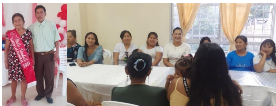
Imagen 31. Evento del día de las madres en "Las Palmeras".