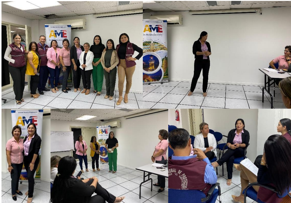
Imagen 125. Participación en el Taller "INCORPORACIÓN DE LOS ENFOQUES DE IGUALDAD Y DERECHOS HUMANOS EN LA GESTIÓN DE LOS GAD MUNICIPALES" organizado por AME Regional 5.