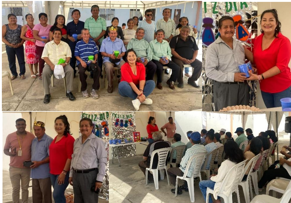
Imagen 73. Día del Padre con Adultos Mayores organizado por MIES.