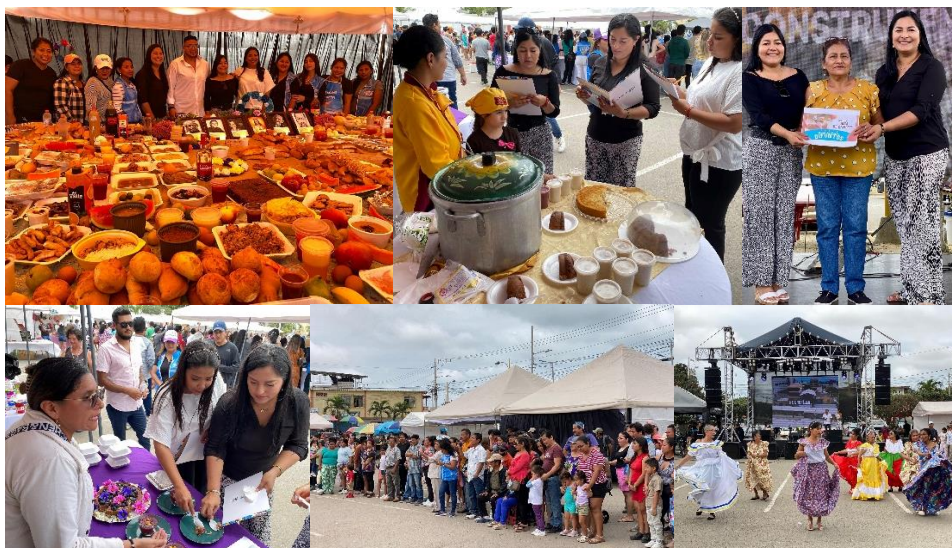
Imagen 153. "Feria Mesa de Fieles Difuntos", en la explanada del Cementerio General.