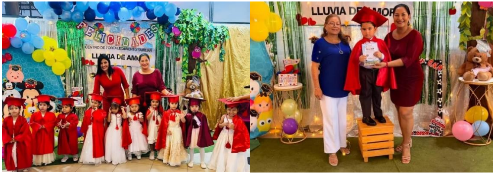
Imagen 3. Graduación de Infantes del Proyecto Social Creyendo en Nuestros Niños de Prefectura.