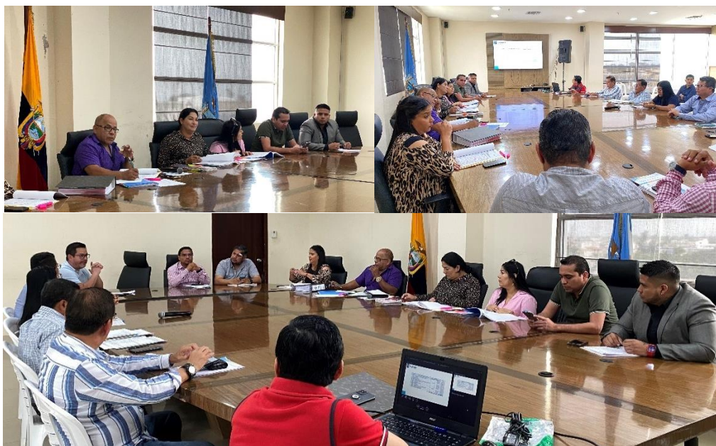
Imagen 115. Mesas de trabajo para tratar Reforma Presupuestaria 2024, en la sala de sesiones del Palacio Municipal.