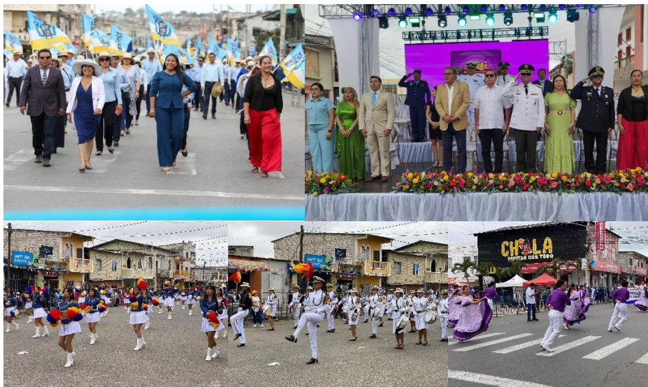
Imagen 158. Desfile Arte, Color y Vida en estos 17 años de provincialización.