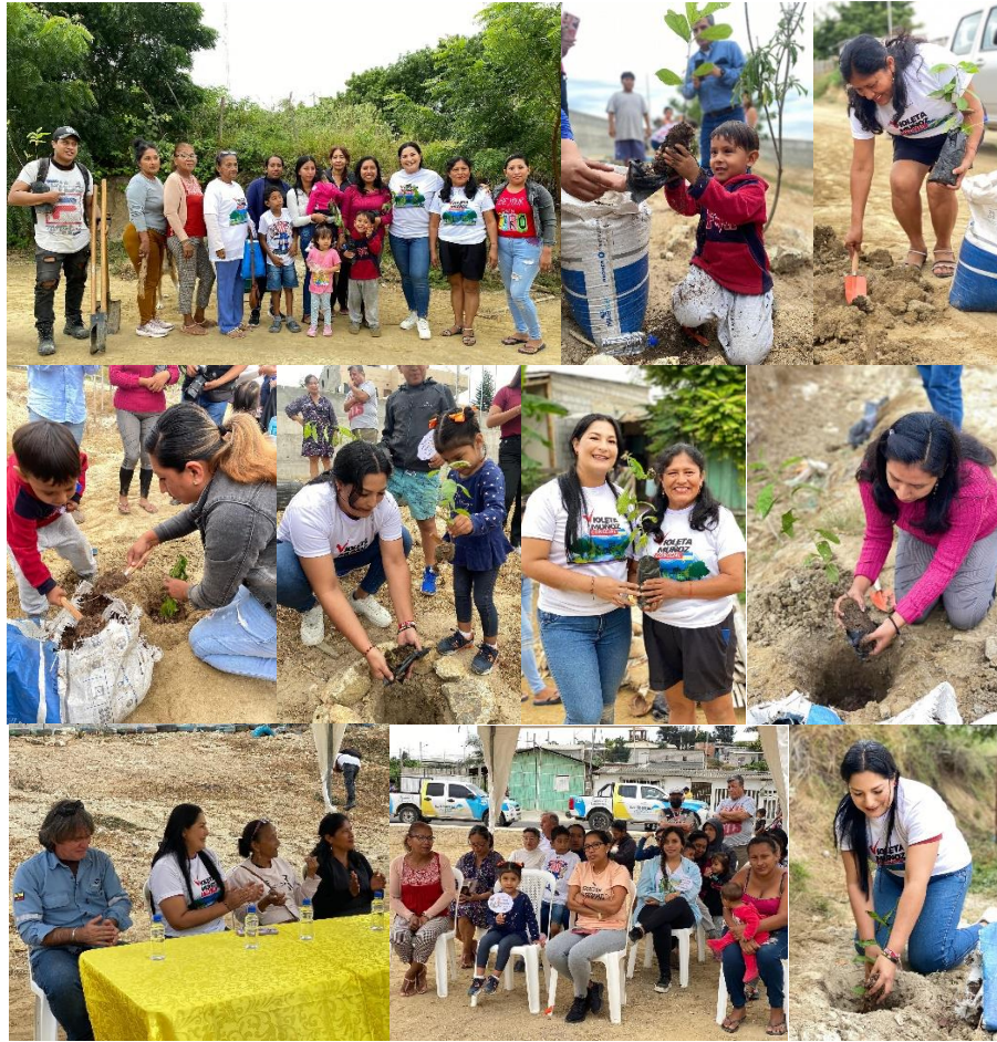
Imagen 52. Siembra árboles maderables en los barrios 9 de Octubre y Las Colinas.