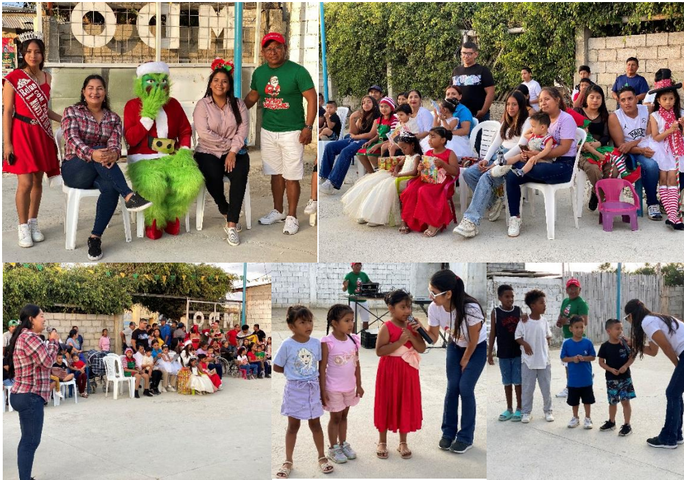
Imagen 199. Agasajo Navideño Barrio Monte de Los Olivos.