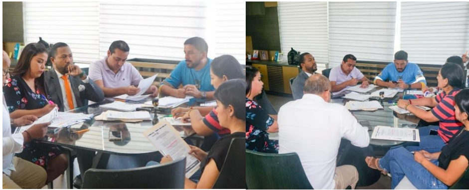
Imagen 36. Sesión Ordinaria de concejo realizada el 16 de mayo del 2024.