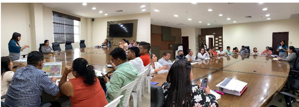
Imagen 108. Mesa de trabajo con los funcionarios del Municipio, para la campaña de legalización de terrenos.