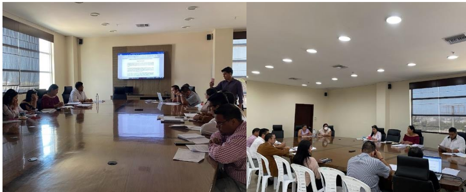
Imagen 17. Mesas de trabajo en la sala de sesiones de GADMCLL.