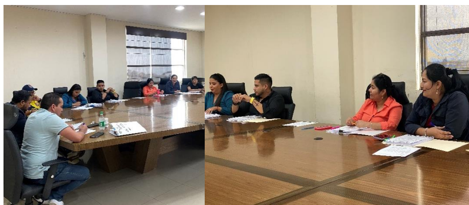
Imagen 60. Sesión Ordinaria de Concejo realizada el 21 de junio del 2024, en la sala de sesiones del GADMCLL.