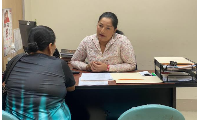
Imagen 6. Atención a usuarios en oficina de la sala de concejales 2 del GADMCLL.