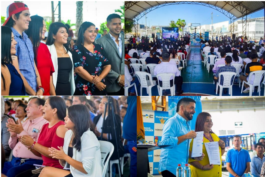
Imagen 18. Participación en la firma de convenio entre el GAD La Libertad y Ministerio de Educación