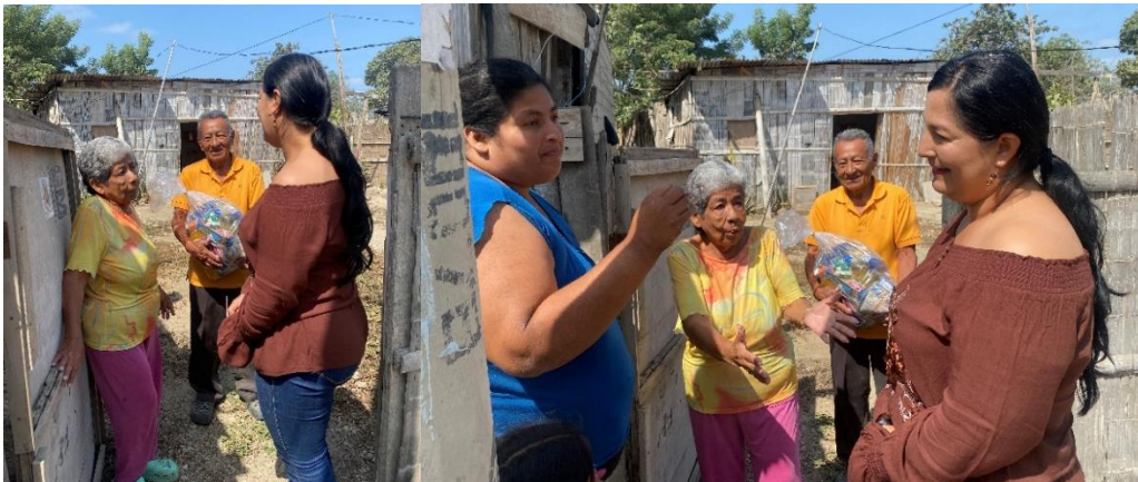
Imagen 95. Entrega de víveres a adultos mayores del Barrio Jaime Nebot del Cantón La Libertad.