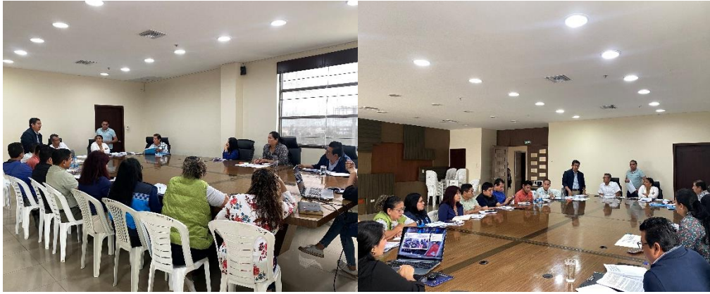
Imagen 141. Reunión de trabajo referente a la Ordenanza Reformatoria Sustitutiva de la Utilización de la Vía, Espacios Públicos y Bienes de Propiedad Municipal del Cantón La Libertad.