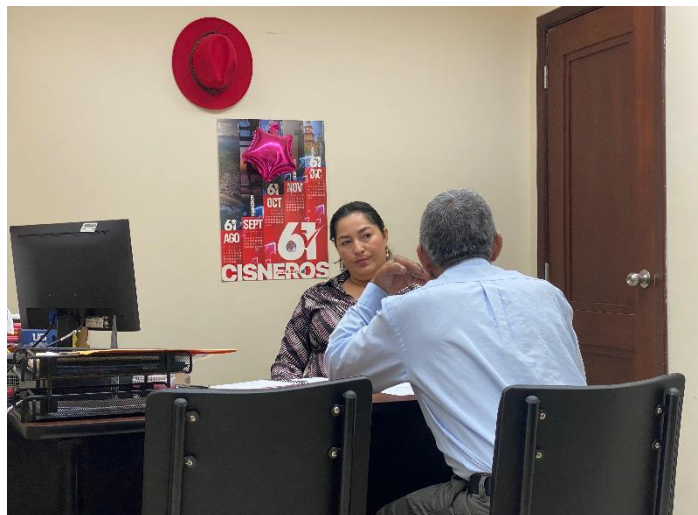
Imagen 150. Atención a usuarios en oficina de la sala de concejales 2 del GADMCLL.