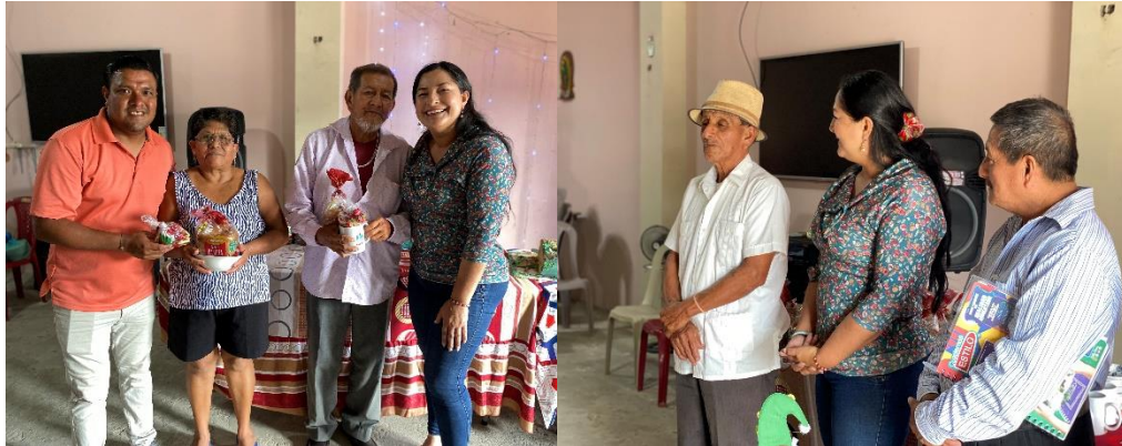
Imagen 207. Agasajo Navideña con los adultos mayores de la Ciudadela San Vicente.