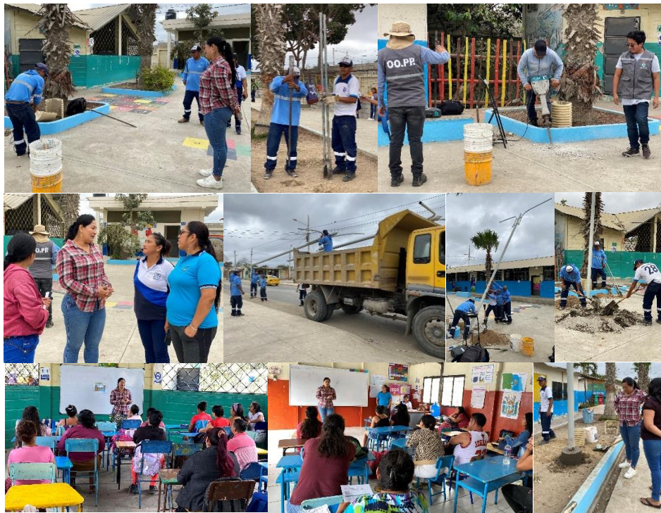
Imagen 139. Colocación de tubos Escuela de Educación Básica "Ing. Sixto Chang Cansing".