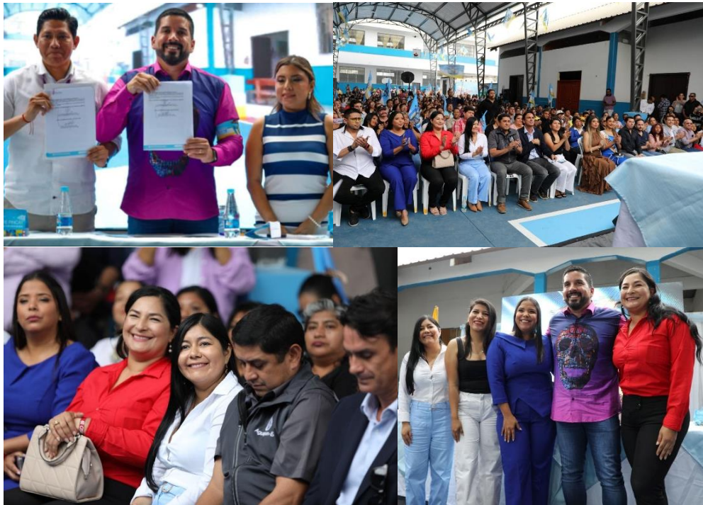
Imagen 128. Firma del primer convenio interinstitucional con el Ministerio de Educación y Evento de entrega de la cubierta del patio de la Unidad de Educación Básica "Domingo Faustino Sarmiento".