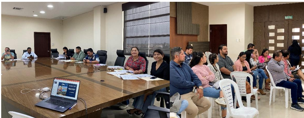
Imagen 126. Sesión Extraordinaria y Ordinaria del Gobierno Autónomo Descentralizado Municipal del Cantón La Libertad realizada el 12 de septiembre del 2024, en la sala de sesiones del Palacio Municipal.