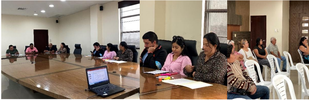
Imagen 116. Sesión Ordinaria del Gobierno Autónomo Descentralizado Municipal del Cantón La Libertad realizada el 29 de agosto del 2024, en la sala de sesiones del Palacio Municipal.