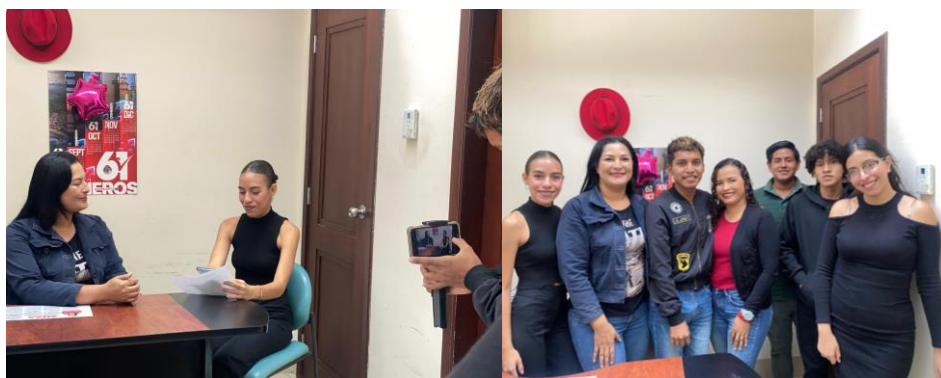
Imagen 59. Entrevista para estudiantes de la UPSE.