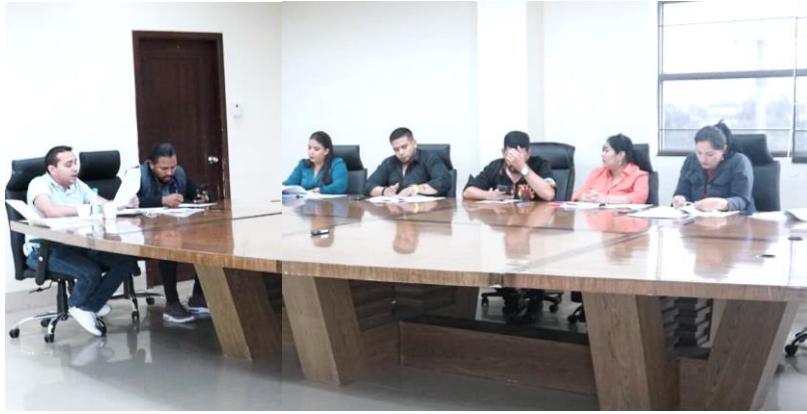
Imagen 16. Sesión Ordinaria de Concejo en la sala de sesiones del Palacio Municipal.