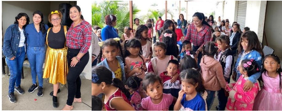
Imagen 48. Día del niño del barrio Colinas de La Libertad.