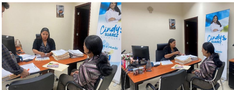
Imagen 90. Sesión Ordinaria de la Comisión Ocasional de Terrenos.