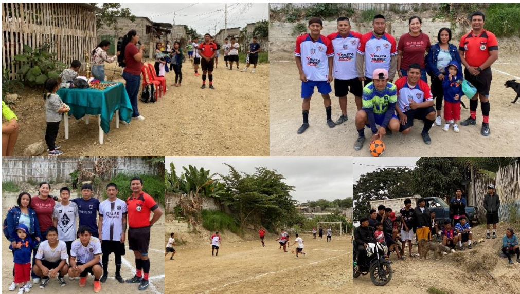
Imagen 98. Participación en el Cuadrangular de Indor en el Barrio El Bosque del Cantón La Libertad.