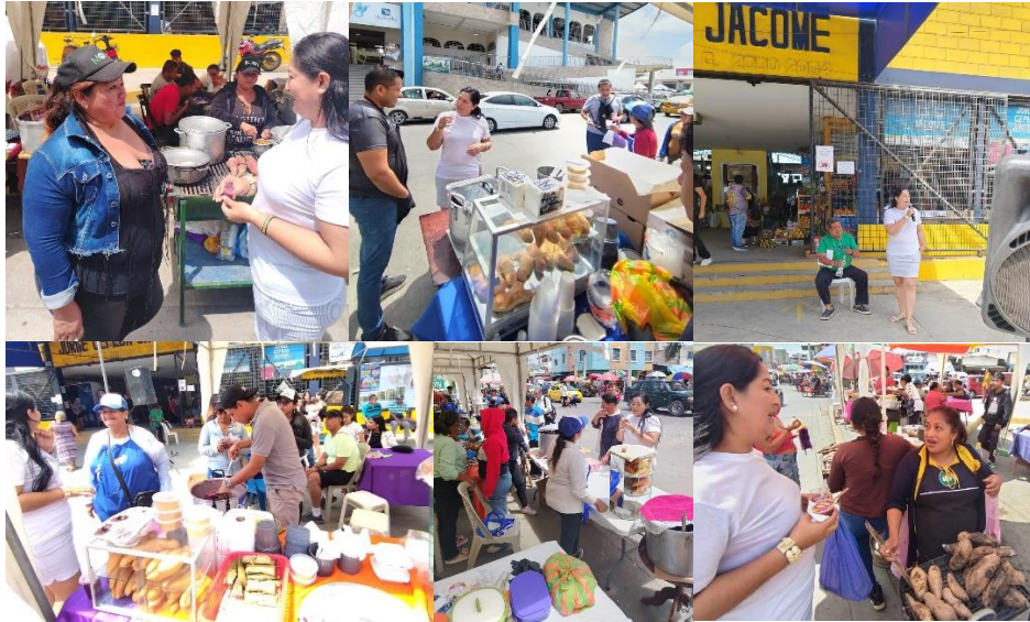
Imagen 151. Feria de gastronomía tradicional del Día de Difuntos en el mercado "Jorge Cepeda Jácome".