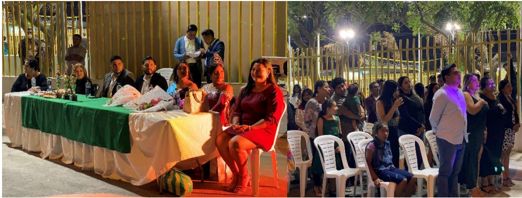
Imagen 174. Sesión Solemne por el Trigésimo primer aniversario de la Ciudadela Nueva Esperanza.