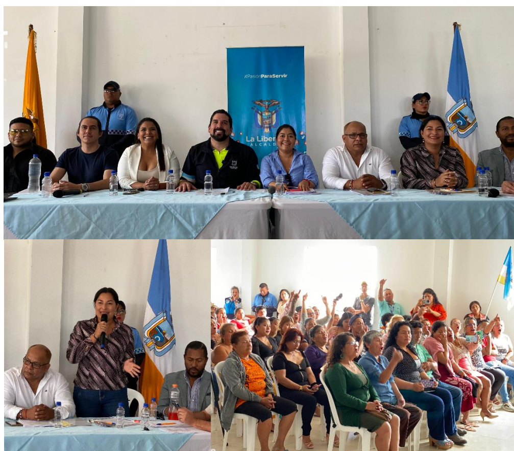
Imagen 177. Sesión Extraordinaria Itinerante del GADMCLL realizada el 26/11/2024, en el Sector 14 de Julio.