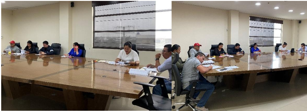
Imagen 172. Sesión Extraordinaria y Ordinaria de Concejo realizada el 21/11/2024, en la sala de sesiones.