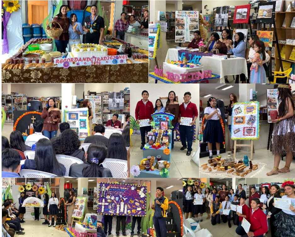
Imagen 148. Evento en honor a la tradicional "Mesa de Difuntos", donde participaron varias unidades educativas del cantón haciendo una reseña histórica de esta tradición.