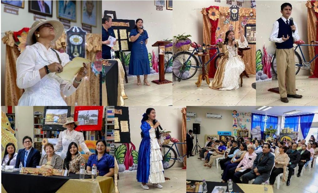
Imagen 100. Evento "Los Poemas de Dolores Veintimilla de Galindo" en la Biblioteca Municipal.