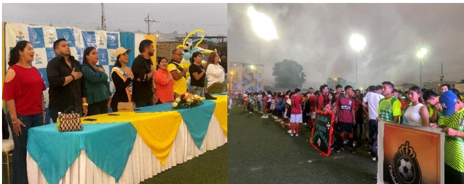
Imagen 66. Inauguración del Inter Barrial de fútbol del cantón la libertad.