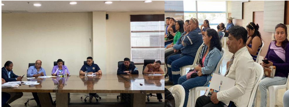
Imagen 162. Sesión Ordinaria del Gobierno Autónomo Descentralizado Municipal del Cantón La Libertad realizada el 13 de noviembre del 2024, en la sala de sesiones del Palacio Municipal.