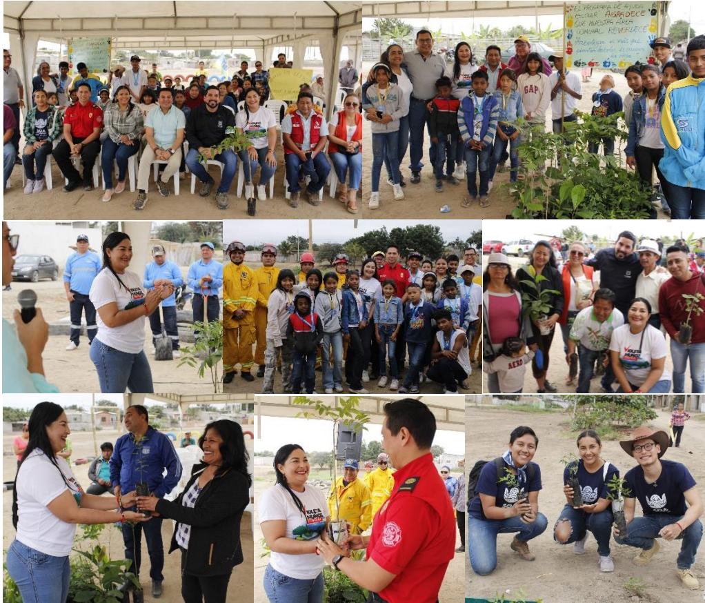
Imagen 133. Siembra de 100 árboles en la reserva municipal Lirio de los Valles.