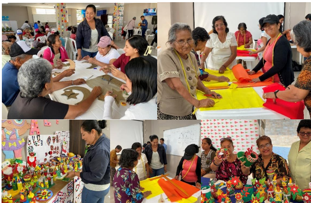
Imagen 183. Participación en los Talleres en beneficio de los adultos mayores, en el Centro Gerontológico Municipal.