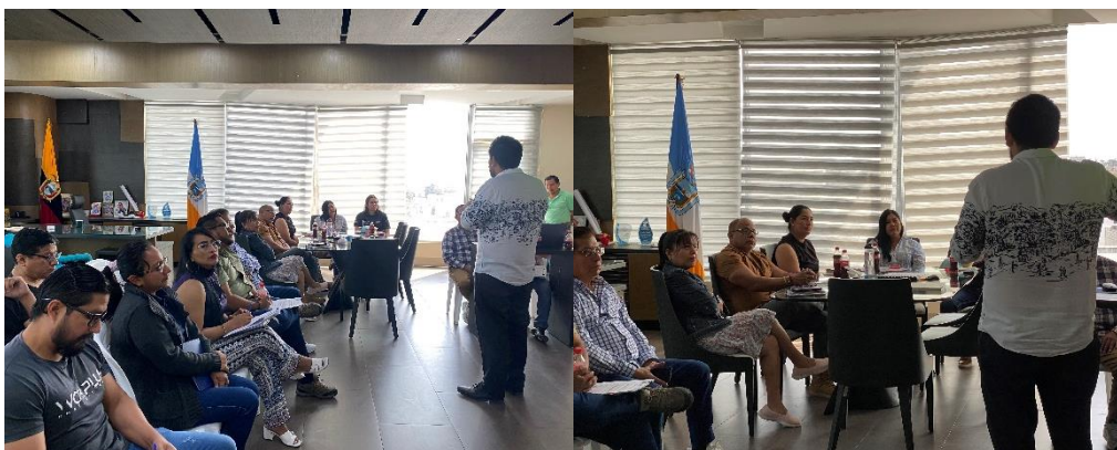
Imagen 182. Reunión de trabajo con funcionarios y directores del GADMCLL.