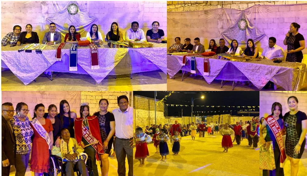
Imagen 137. Aniversario 20 del Barrio Monte de los Olivos se realizó la Sesión Solemne y Coronación de la Reina y Señora Bonita.