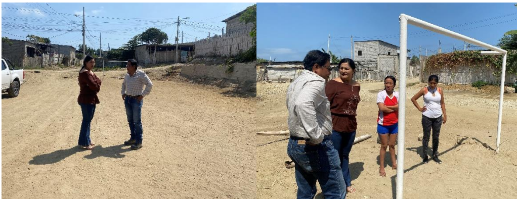
Imagen 96. Inspección de limpieza en el barrio El Bosque.