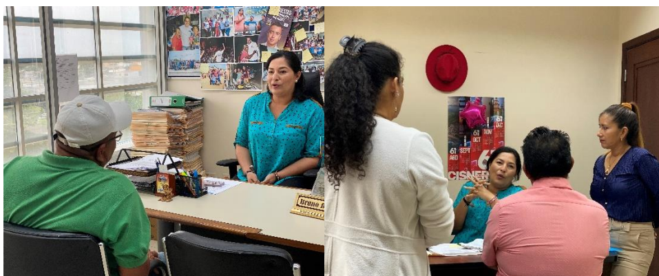
Imagen 89. Atención a usuarios en oficina de la sala de concejales 2 del Gobierno Autónomo Descentralizado Municipal del Cantón La Libertad.