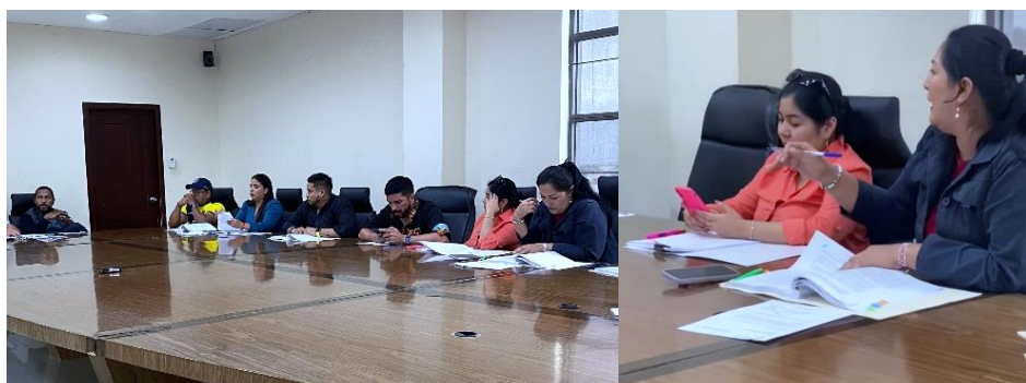
Imagen 68. Sesión de concejo en la sala de sesiones del Palacio Municipal celebrada el 25 de junio del 2024.