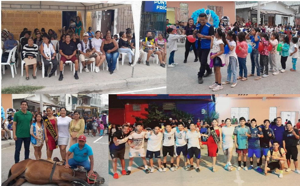
Imagen 124. Programa en el Barrio La Esperanza.