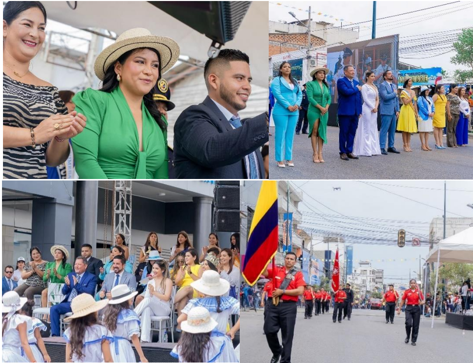
Imagen 24. Participación en el desfile por los 31 años de cantonización de La Libertad.