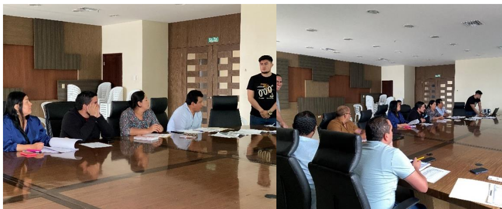
Imagen 142. Sesión Extraordinaria del Gobierno Autónomo Descentralizado Municipal del Cantón La Libertad realizada el 23 de octubre del 2024, en la sala de sesiones del Palacio Municipal.