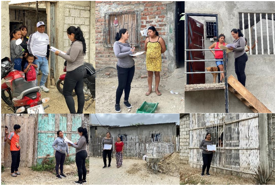
Imagen 69. Inspección de la Comisión Ocasional de Terrenos en los diferentes Barrios del cantón La Libertad.