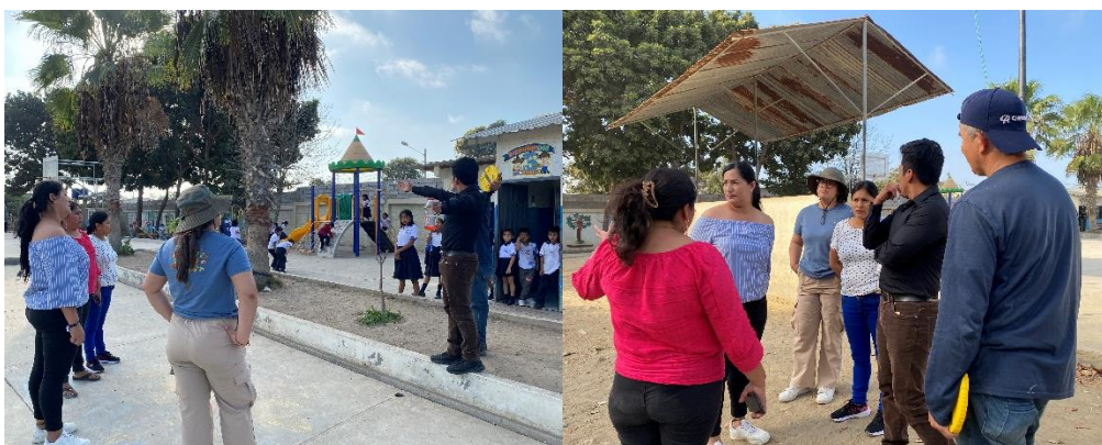
Imagen 93. Visita INSITU en la Escuela de Educación Básica "Ing. Sixto Chang Cansing" para la colocación de postes e iluminarias en el plantel educativo.