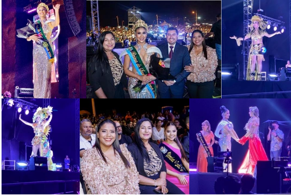
Imagen 154. Elección de Reina de la Provincia de Santa Elena.