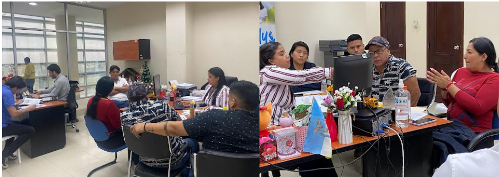
Imagen 10. Reunión de trabajo referente a trámites de Terrenos de usuarios del cantón La Libertad.