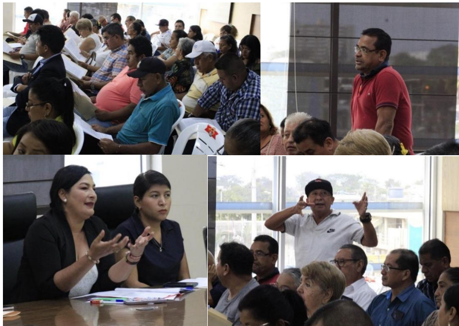
Imagen 29. Socialización del proyecto de Ordenanza de Arbolado Urbano del Cantón La Libertad, en la Sala de Sesiones del Palacio Municipal.