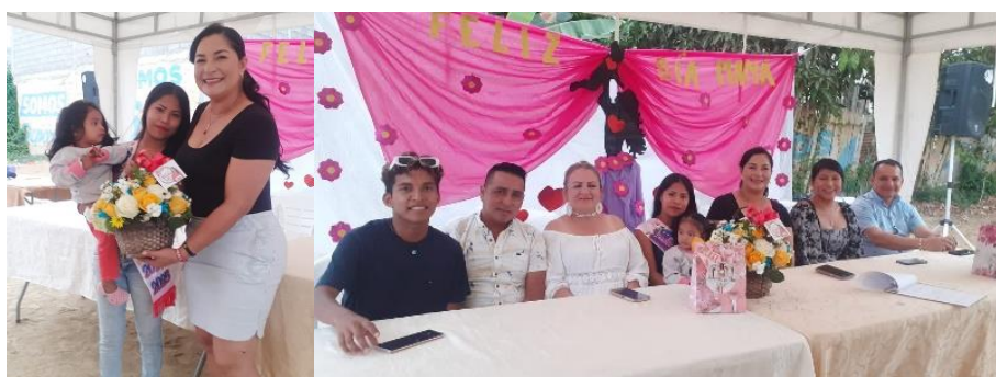
Imagen 45. Día de las madres en el Barrio "Cumbres de la Libertad".