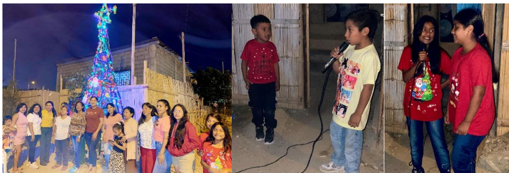
Imagen 192. Encendida de árbol en Las Colinas.