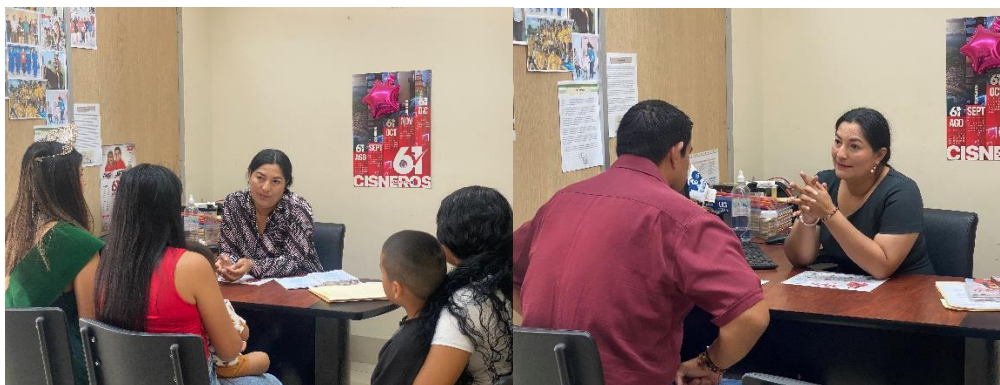
Imagen 163. Atención a usuarios en oficina de la sala de concejales 2 del GADMCLL.