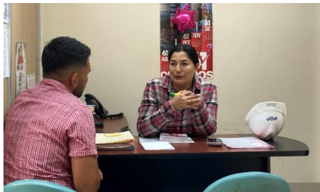
Imagen 112. Atención a usuarios en oficina de la sala de concejales 2 del GADMCLL.