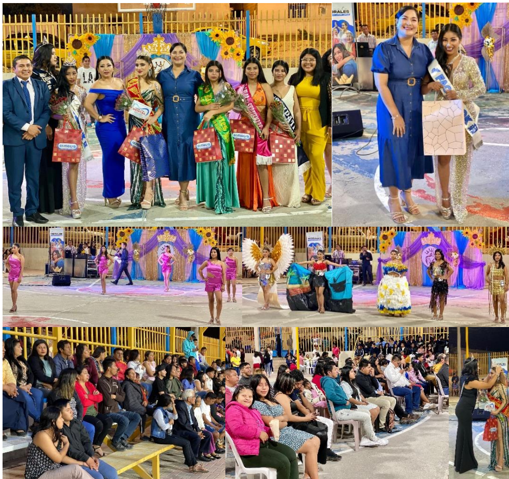
Imagen 129. Elección de Reina y su corte de honor en el barrio 7 de septiembre en sus 41 años de fundación.