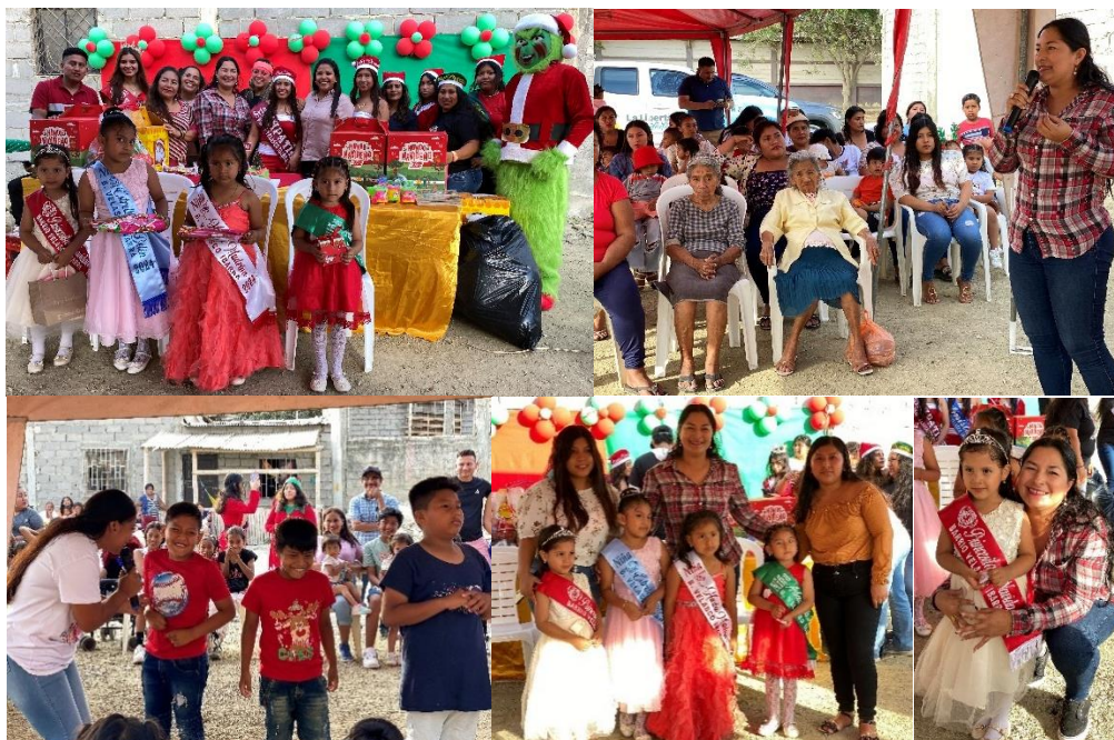
Imagen 198. Participación en el Agasajo Navideño del Barrio Velasco Ibarra.