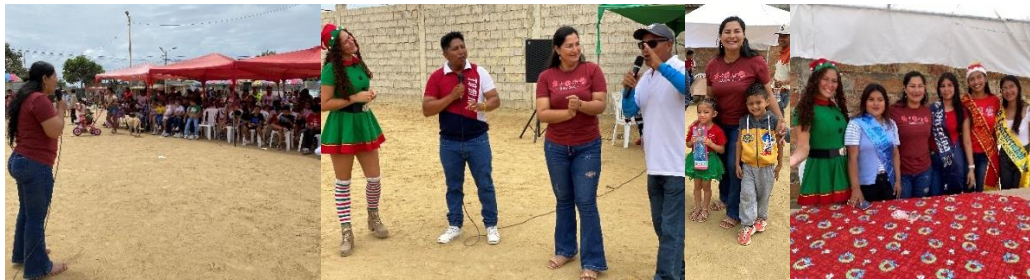
Imagen 204. Participación en la Fiesta Navideña del Barrio Colinas de La Libertad.