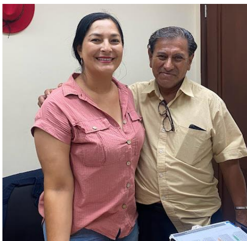
Imagen 2. Atención a usuarios en oficina de la sala de concejales 2 del GADMCLL.