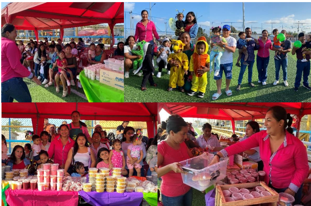
Imagen 173. Integración del Proyecto CNN de Prefectura.