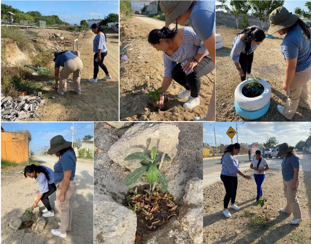
Imagen 94. Inspección de los árboles plantados en los diferentes barrios del Cantón La Libertad.