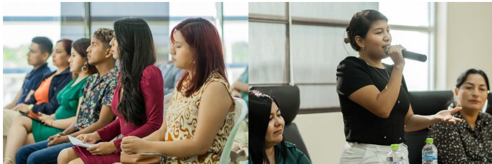
Imagen 28. Participación en la posesión del Consejo Consultivo de Jóvenes del Cantón La Libertad.