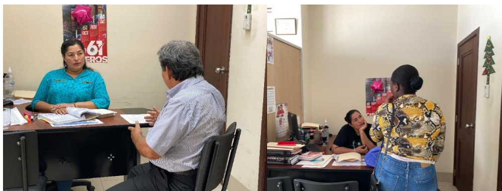
Imagen 195. Atención a usuarios en oficina de la sala de concejales 2 del GADMCLL.