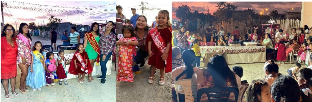
Imagen 200. Agasajo Navideño del Barrio 16 de Octubre.