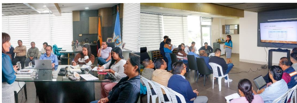
Imagen 55. Mesa de trabajo de la Comisión Ocasional de Terrenos en la Alcaldía.