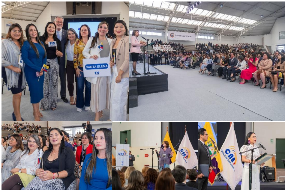
Imagen 57. Participación en el cierre de la cruzada institucional y ciudadana "100 AÑOS DE MUJERES ELIGIENDO".