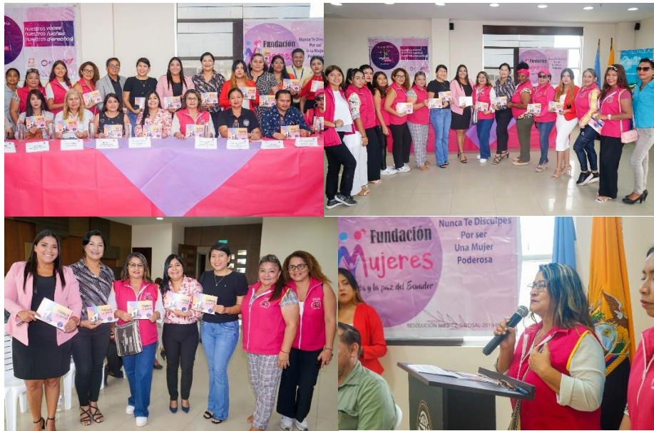
Imagen 40. Presentación y entrega de Agenda Social Feminista del Cantón La Libertad realizada por La Plataforma De Mujeres Caminando Hacia La Igualdad- Santa Elena.