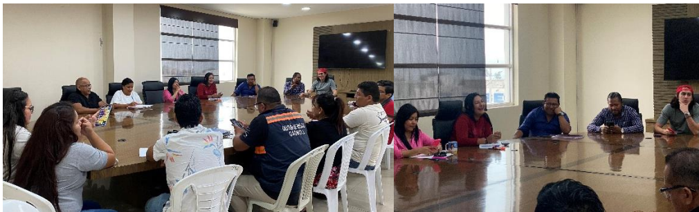
Imagen 168. Reunión de Trabajo en la sala de sesiones del Palacio Municipal.