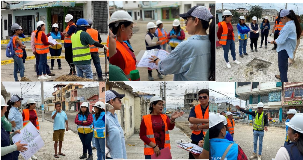
Imagen 103. Inspección en conjunto con el departamento de ambiente en el sector 1 y 4 del proyecto de Rehabilitación Vial de la CAF.