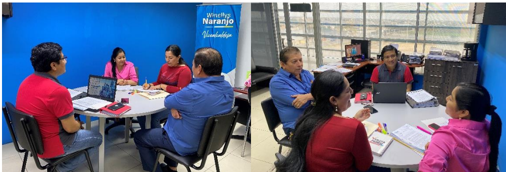
Imagen 169. Reunión de Trabajo referente a la Proforma Presupuestaria para el ejercicio fiscal 2025.