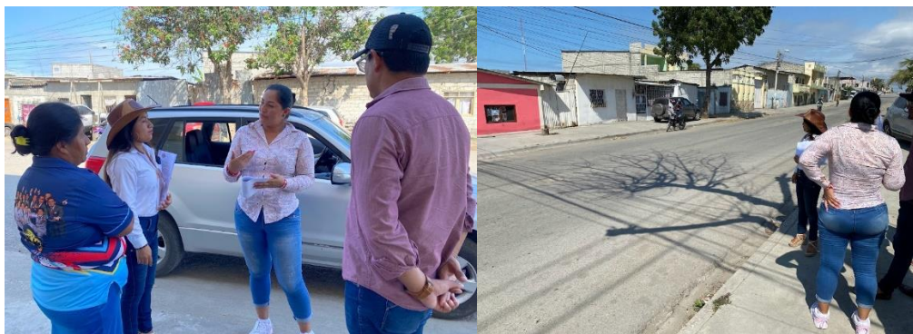
Imagen 11. Inspección INSITU en el Barrio 6 de Diciembre.