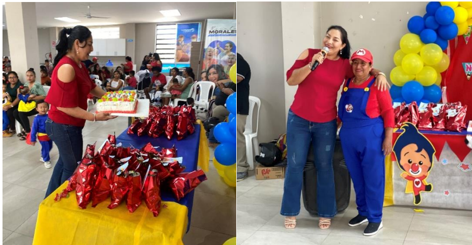
Imagen 64. Día del Niño en el centro gerontológico.