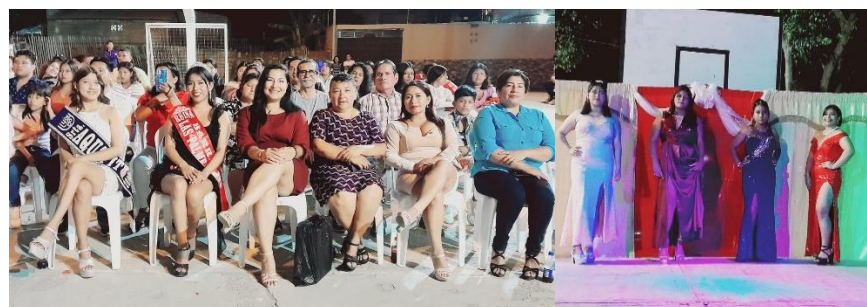
Imagen 35. Elección de reina en el Barrio "Las Palmeras".