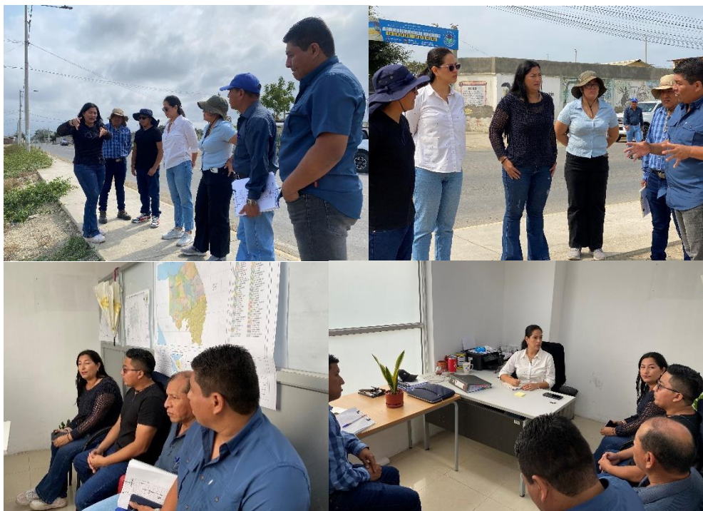
Imagen 166. Inspección INSITU con el departamento de Planificación, Obras Publicas, Higiene y Riesgo para verificar los sectores beneficiados en el proyecto del Parque Lineal.