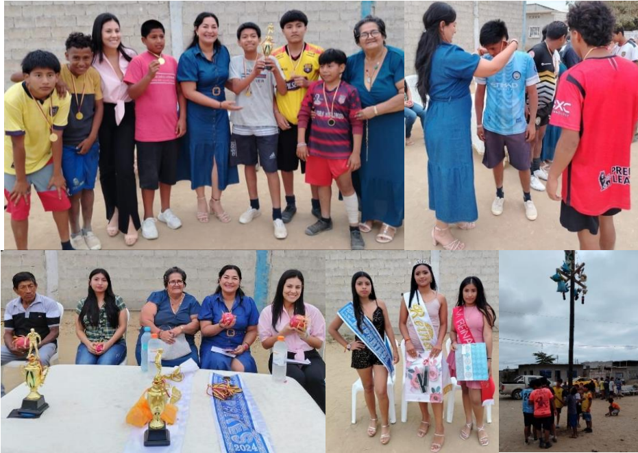
Imagen 146. Elección y Coronación de Reina en el Barrio "El Salvador".