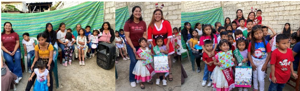
Imagen 205. Fiesta Navideña del Barrio Manabí.