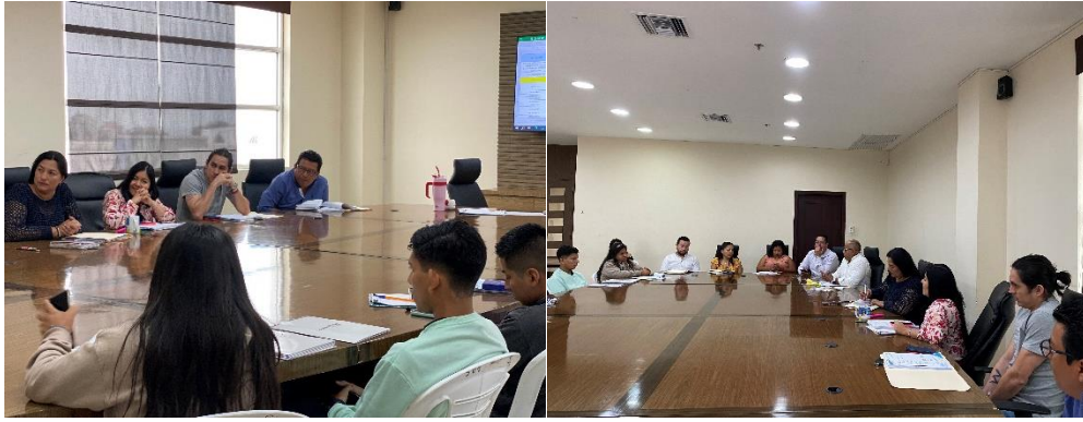
Imagen 167. Mesas de Trabajo referente a la Proforma Presupuestaria para el ejercicio fiscal 2025 en la Sala de sesiones del GADMCLL.