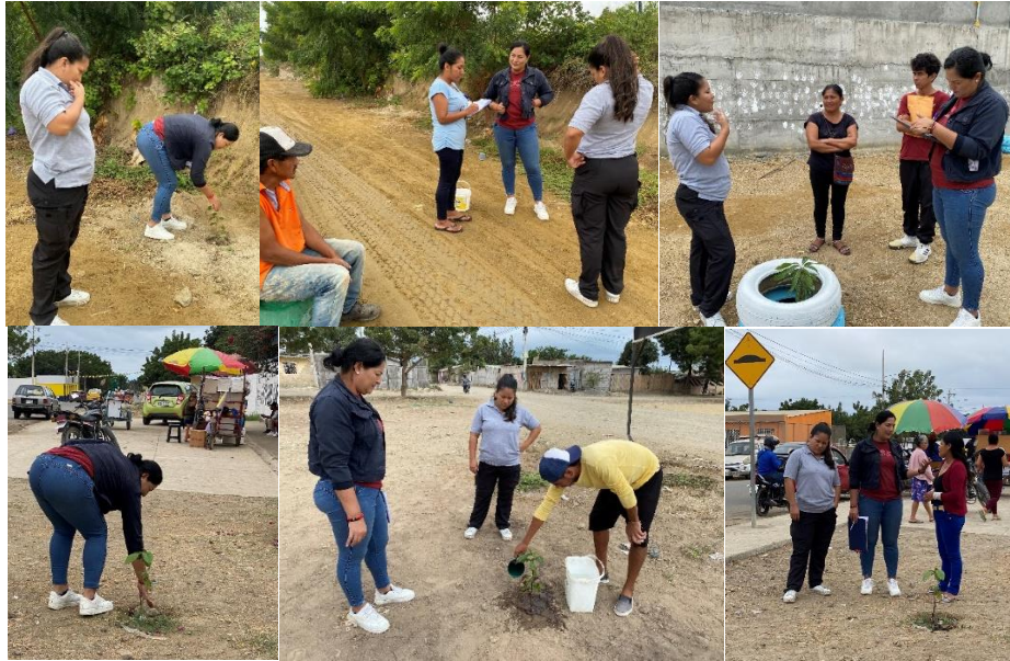
Imagen 79. Inspección de los árboles plantados en los diferentes barrios del Cantón La Libertad.