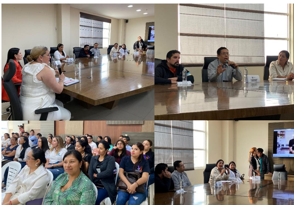
Imagen 176. Participación en el foro "Construyamos Una Vida Mejor Venciendo El Silencio" en por el Día Internacional de la Eliminación de la Violencia contra la Mujer.