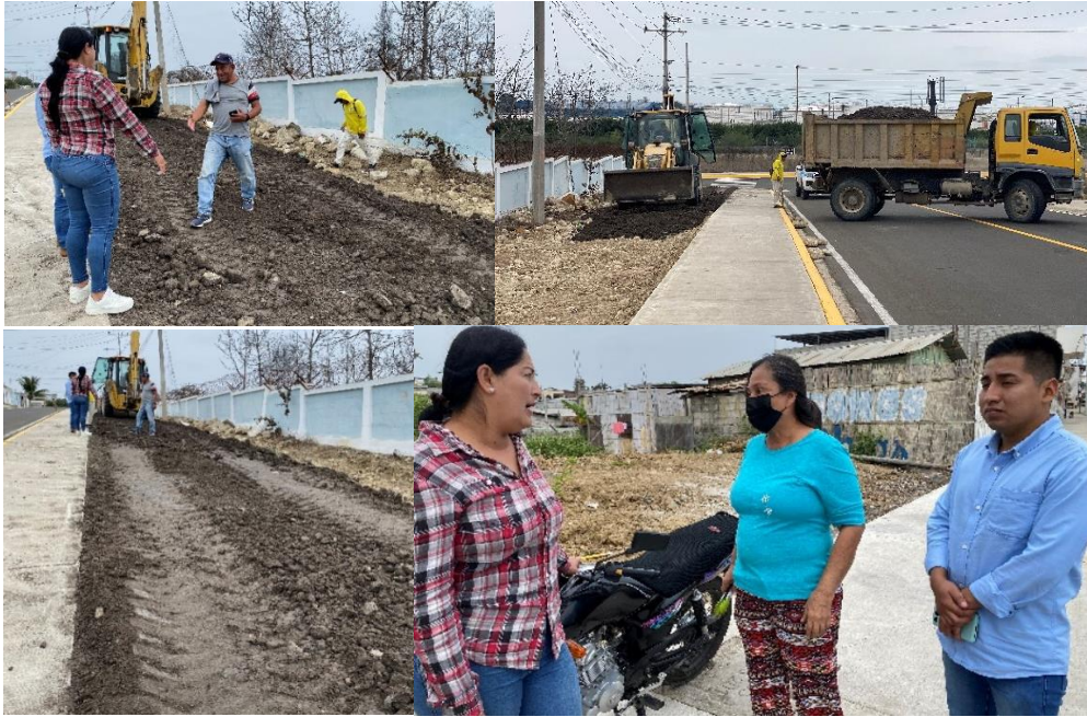
Imagen 113. Inspección del relleno y aplanamiento de la zona de siembra de árboles en el Barrio Las Colinas.